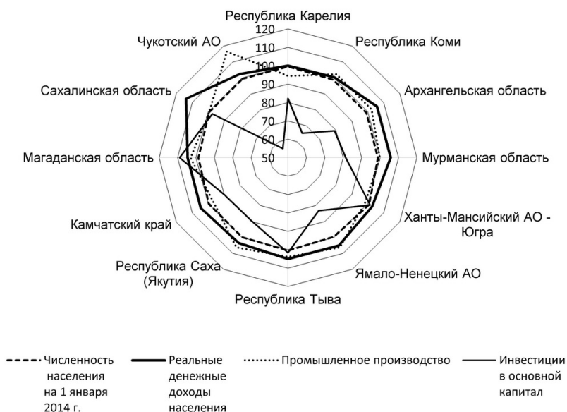
Рис. 2. Индексы динамики социально-экономических показателей 13 северных районов России 14 , 2013 г. в % к 2012 г.