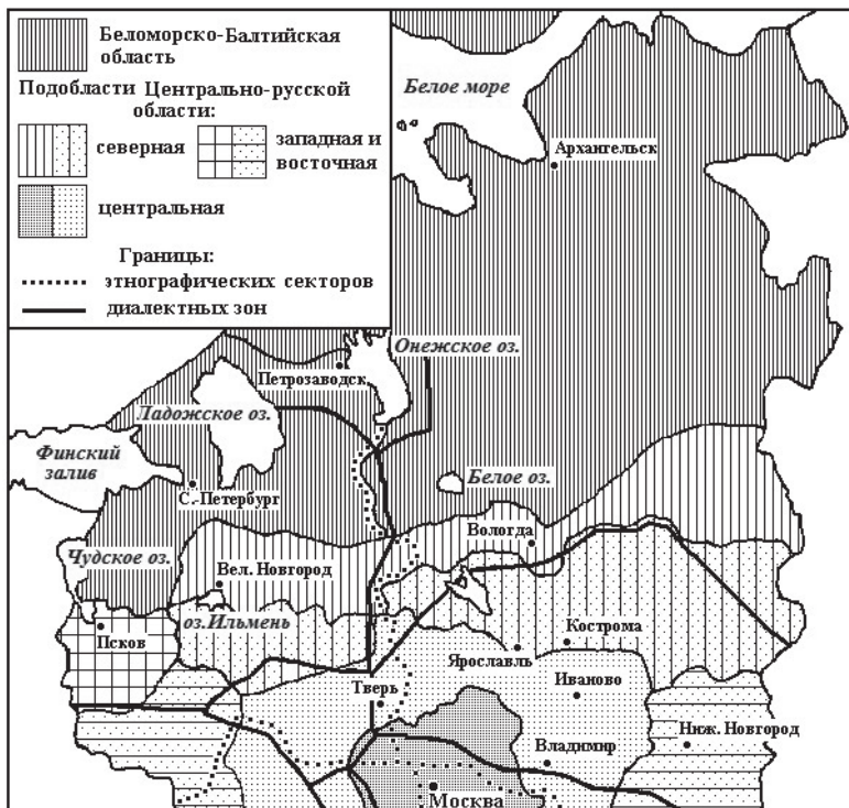
Рис. 2. Историко-этнографические области севера Европейской России (составлено автором с опорой на источники: [20; 21])

С определением историко-этнографических областей, называемых также историко-культурными областями, связано понятие хозяйственно-культурных типов — типов культуры, сложившихся вследствие сходных природных условий обитания и общих видов традиционной хозяйственной деятельности [5; 11; 12]. Авторы концепции выделили на территории Европейской России несколько историко-культурных областей (ИКО).