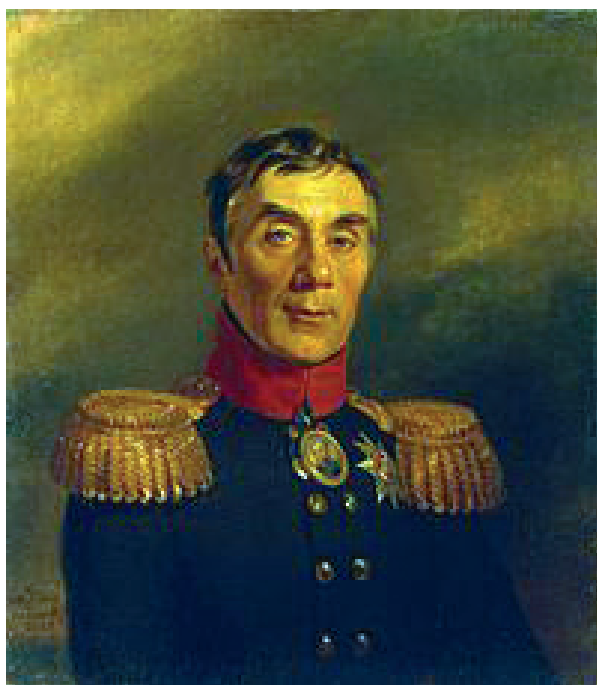
А. А. Аракчеев.