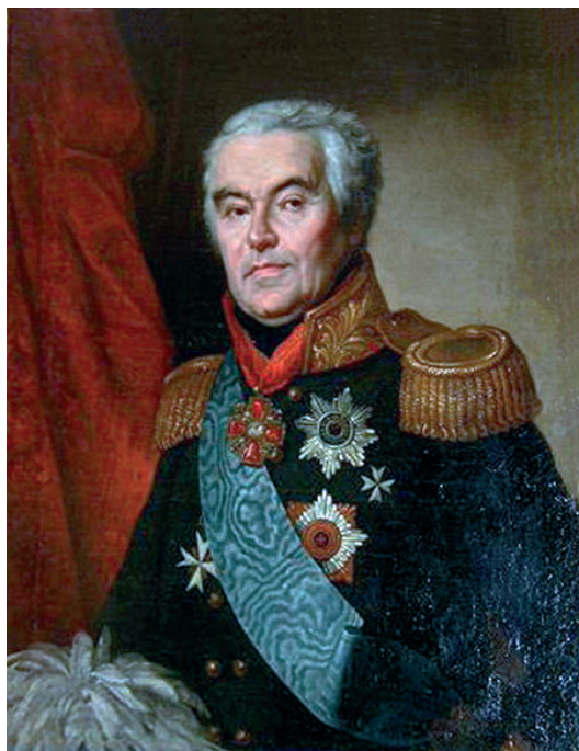
С. К. Вязьмитинов. Худ. О. А. Кипренский. 1819