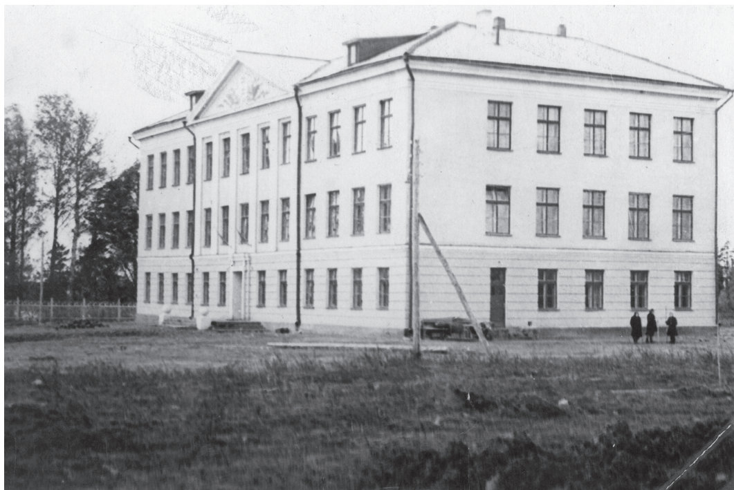
Глубоковская средняя школа. Построена в 1959 году