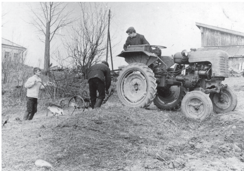
Получение специальности тракториста-машиниста в школе