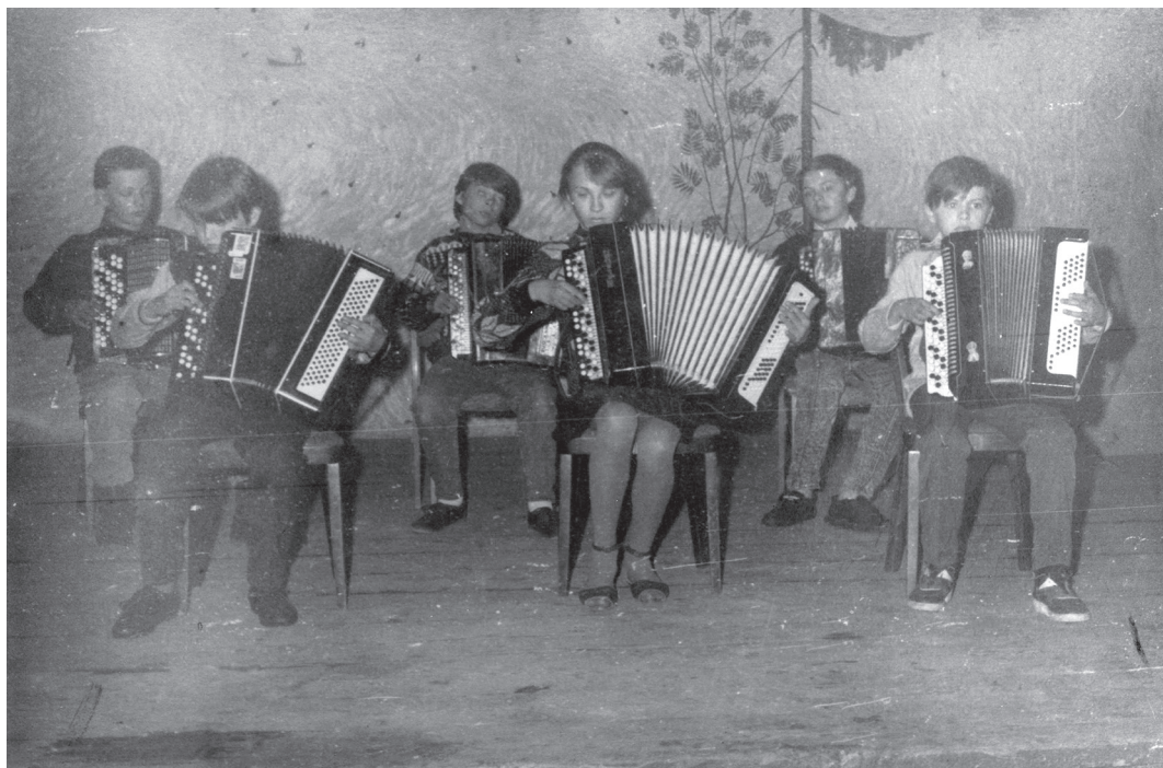
Ученики могли найти применение своим способностям и увлечениям