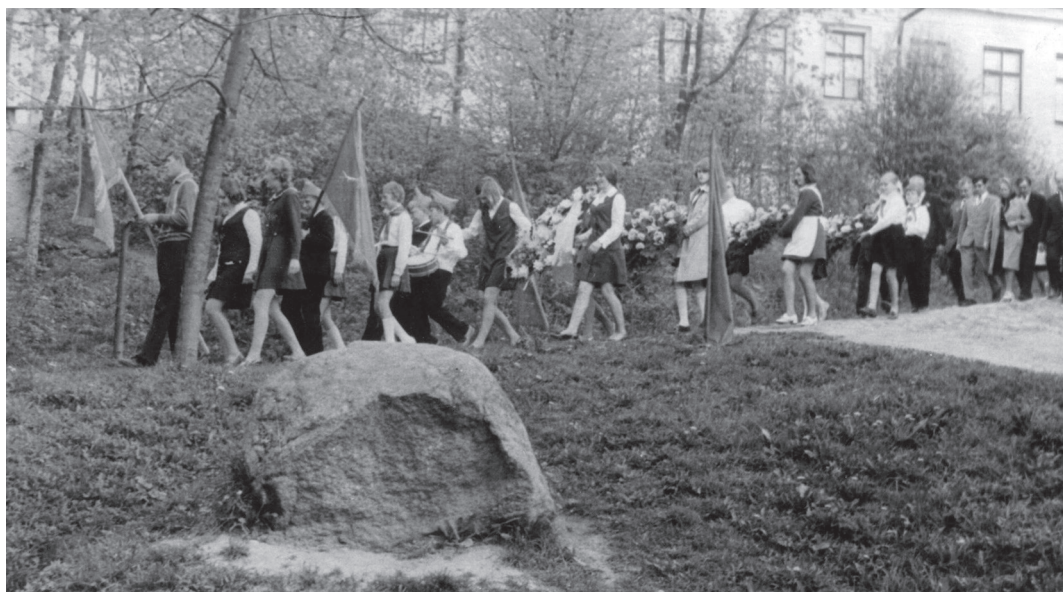
«Никто не забыт, ничто не забыто»