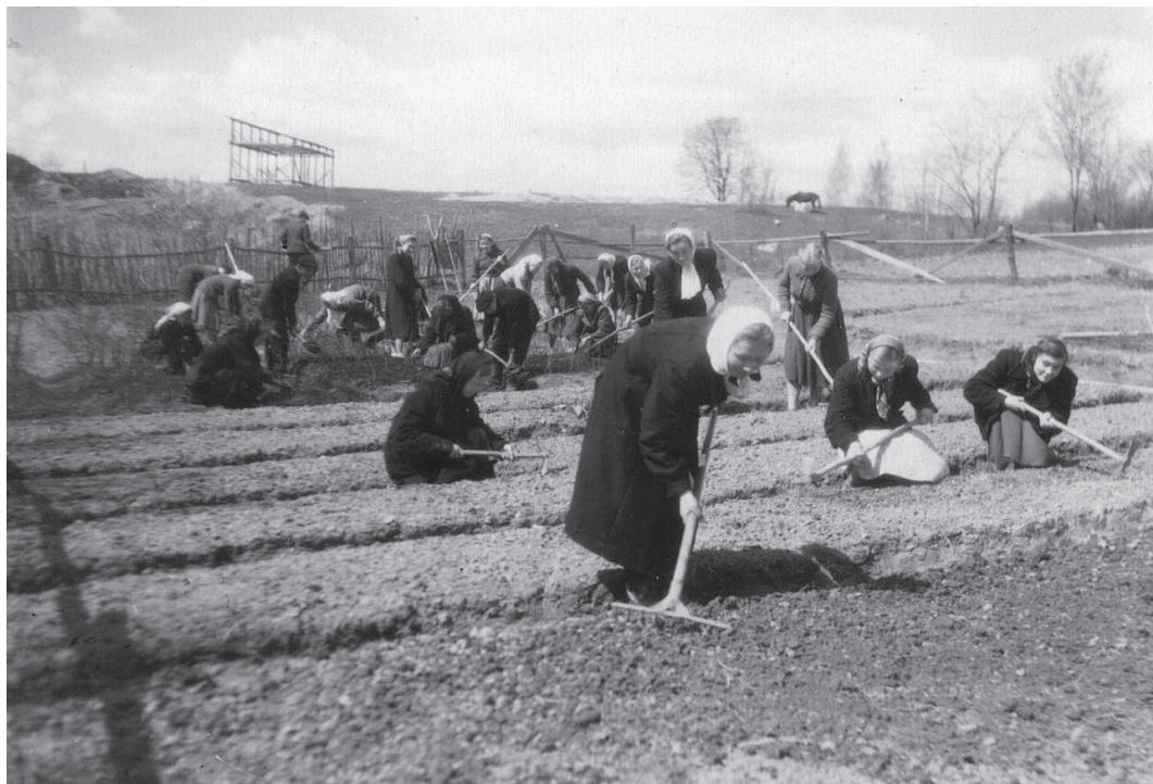
Работа на пришкольном участке