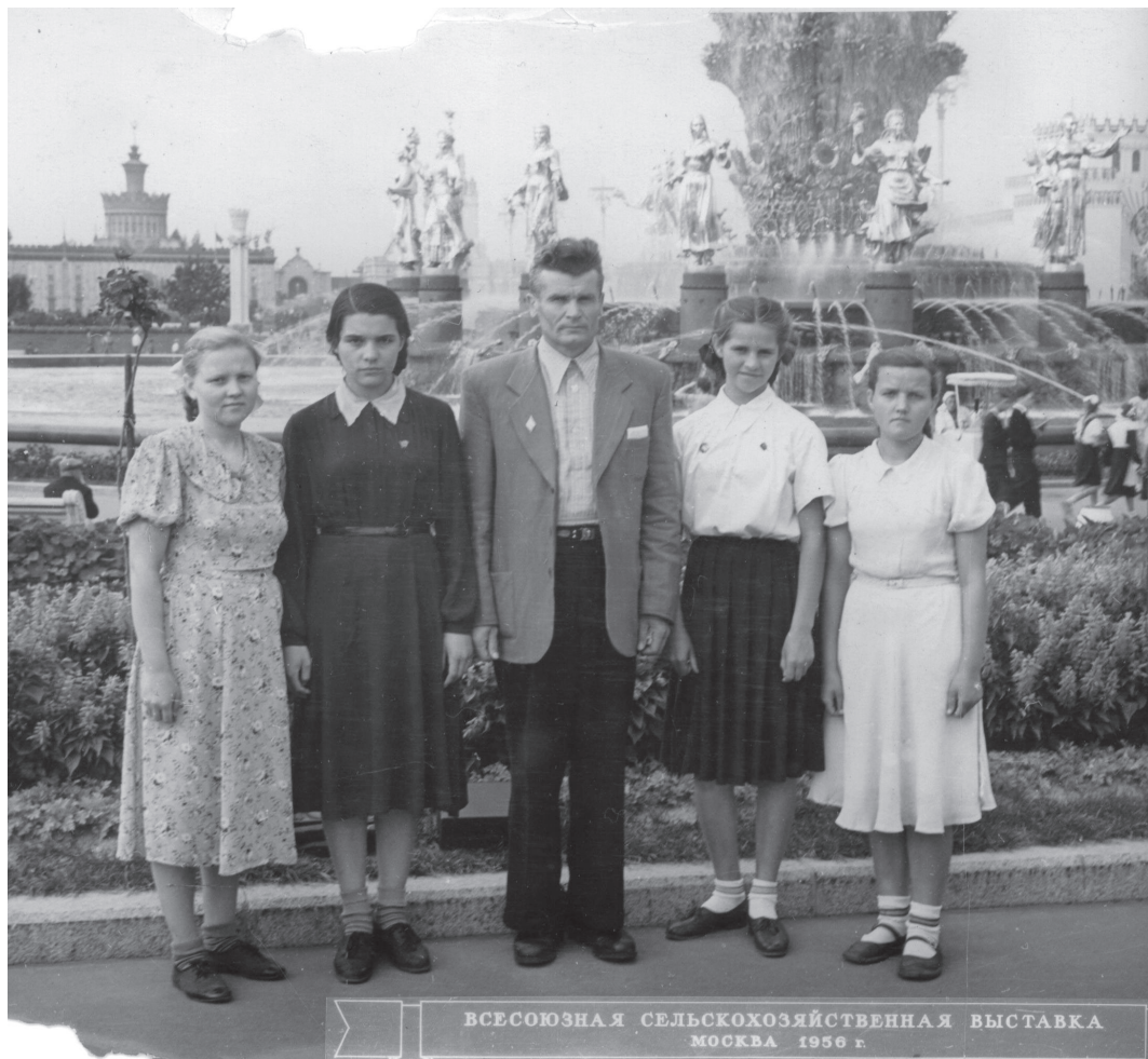
Участники Всесоюзной сельскохозяйственной выставки