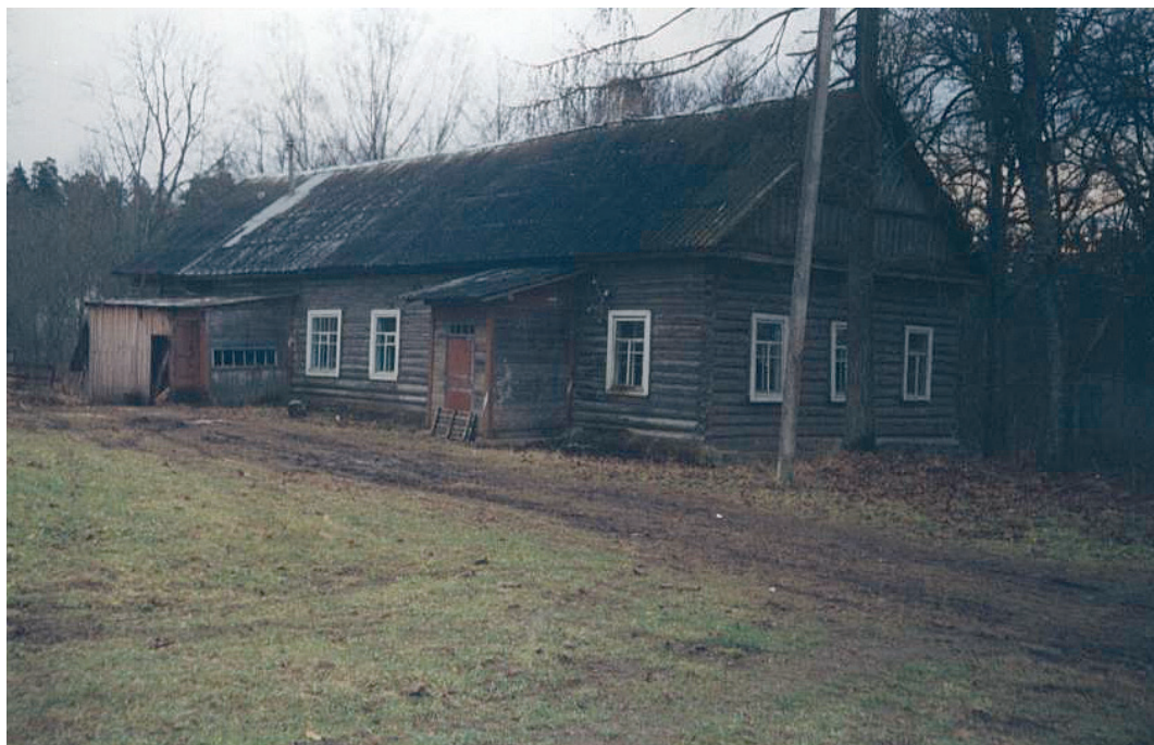
Здание Глубоковской школы до 1959 года