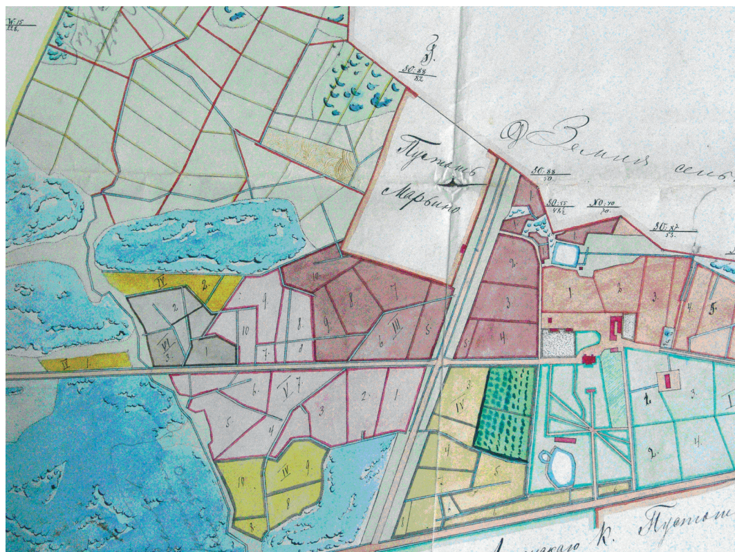
Илл. 7. Центральный фрагмент чертежа «План села Горай с пустошью Журавлево Опочецкого уезда, владения помещика барона Георгия Розена» (ГАПО. ф. 196. оп. 1. д. 1608)