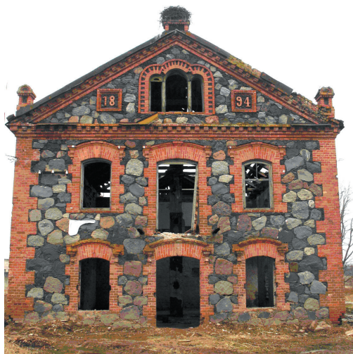
Илл. 3. Главный (восточный) фасад здания (март 2014 г.)