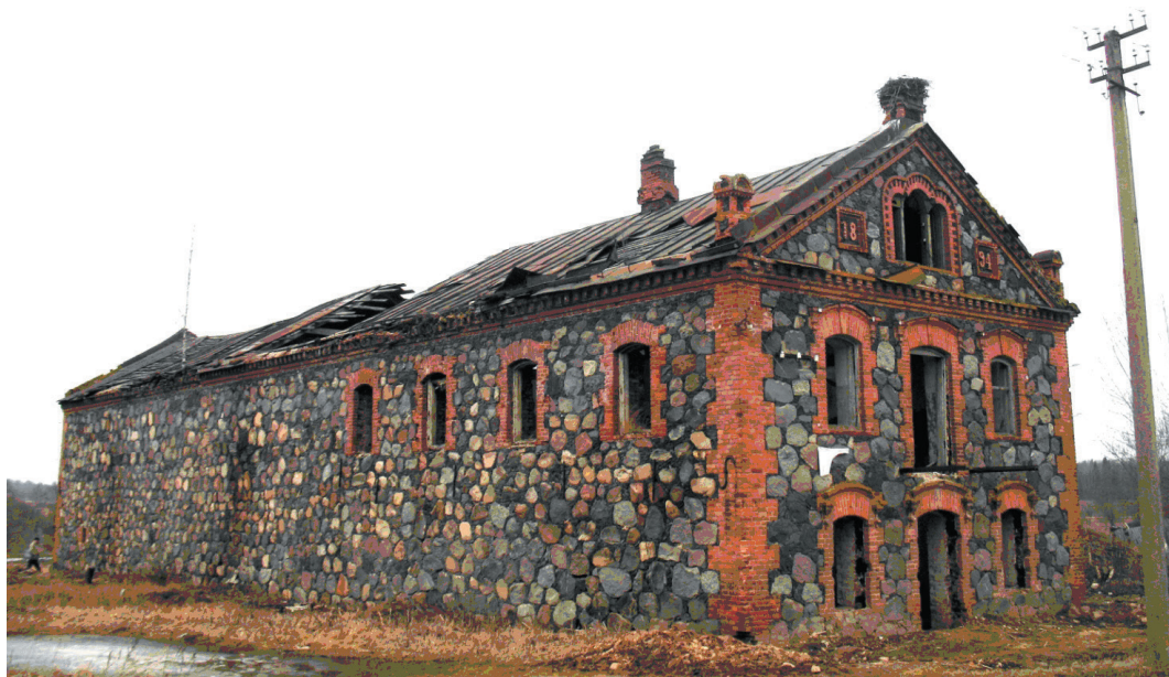
Илл. 1. Общий вид здания с юго-восточной стороны (март 2014 г.)