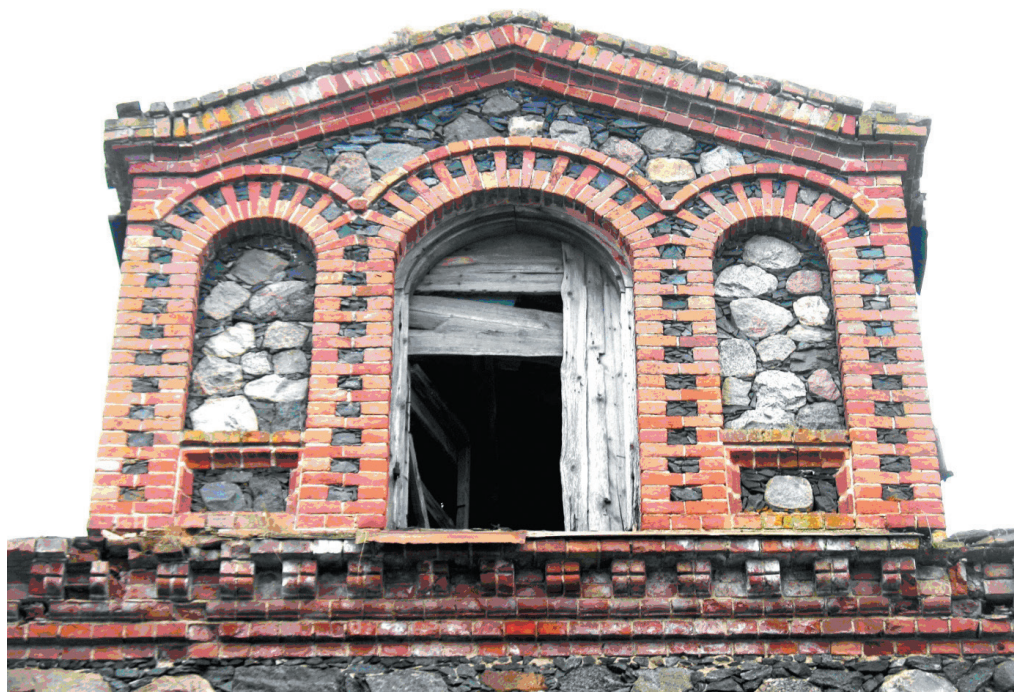
Илл. 2. Мезонин над северным фасадом (апрель 2014 г.)