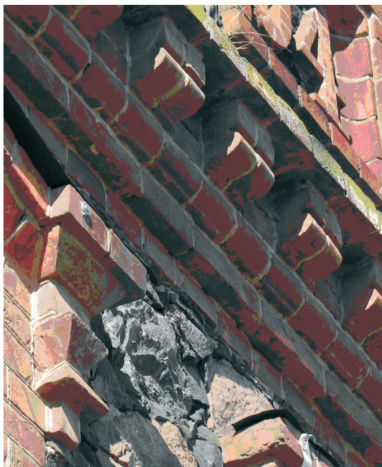
Илл. 6. Кирпичный архитектурный декор главного фасада здания (апрель 2014 г.)