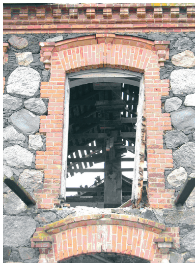
Илл. 4. Проем балконной двери и несущих балок утраченного балкона на восточном фасаде (апрель 2014 г.)