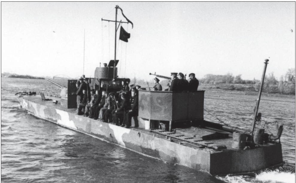
Бронекатер пр. 1125