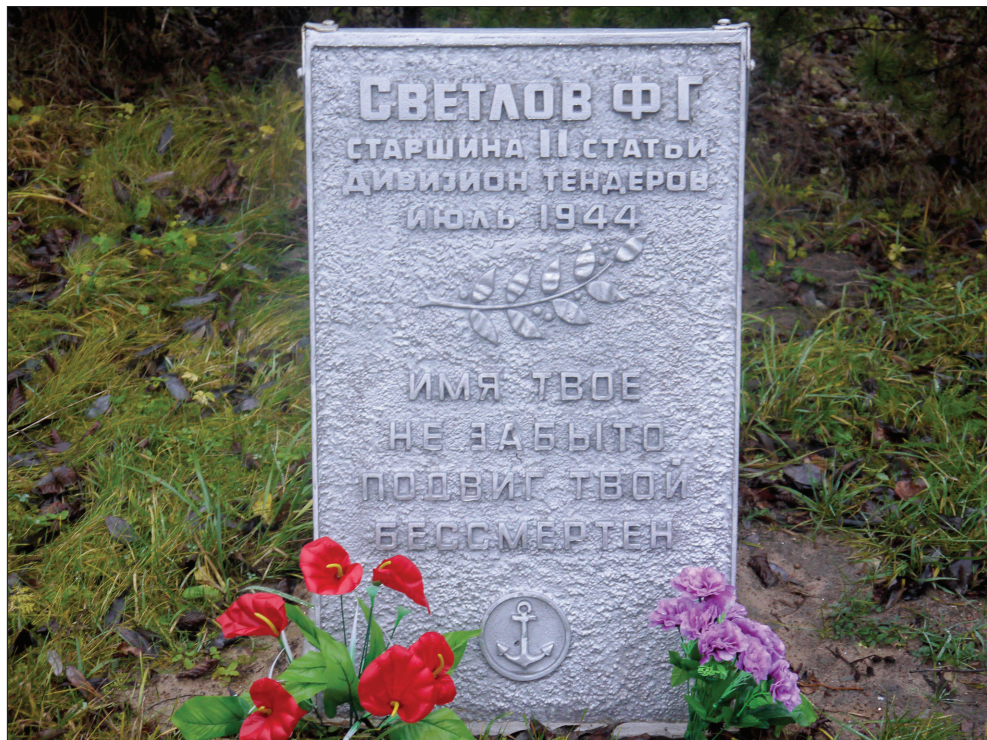
Обелиск в д. Пнево