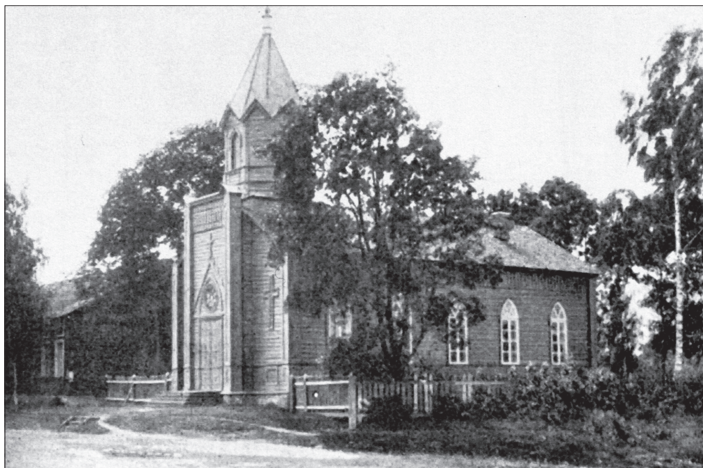
Опочка. Лютеранская кирха