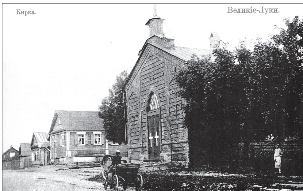
Великие Луки. Кирха