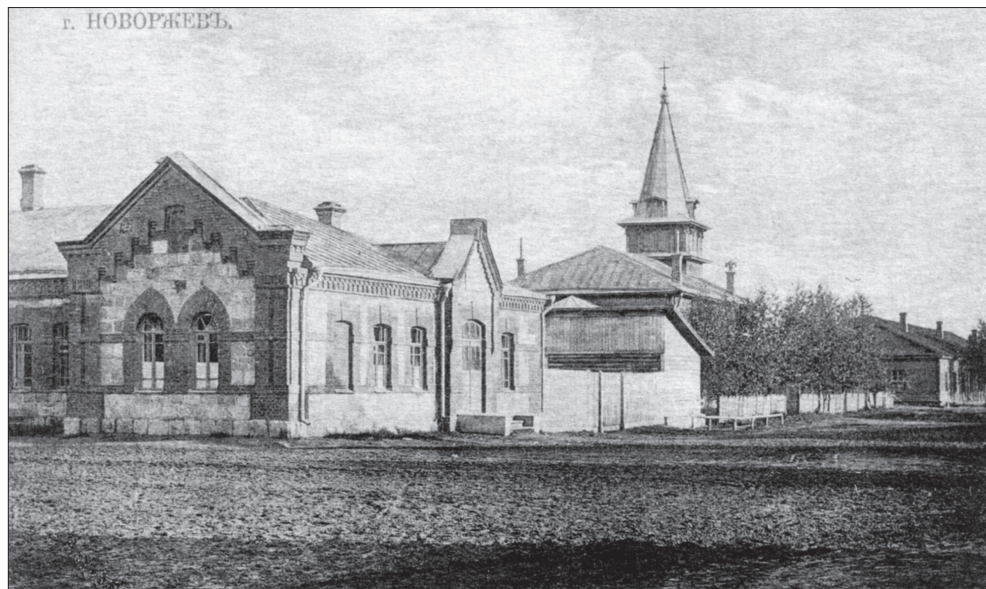
Новоржев. Земская аптека и кирха