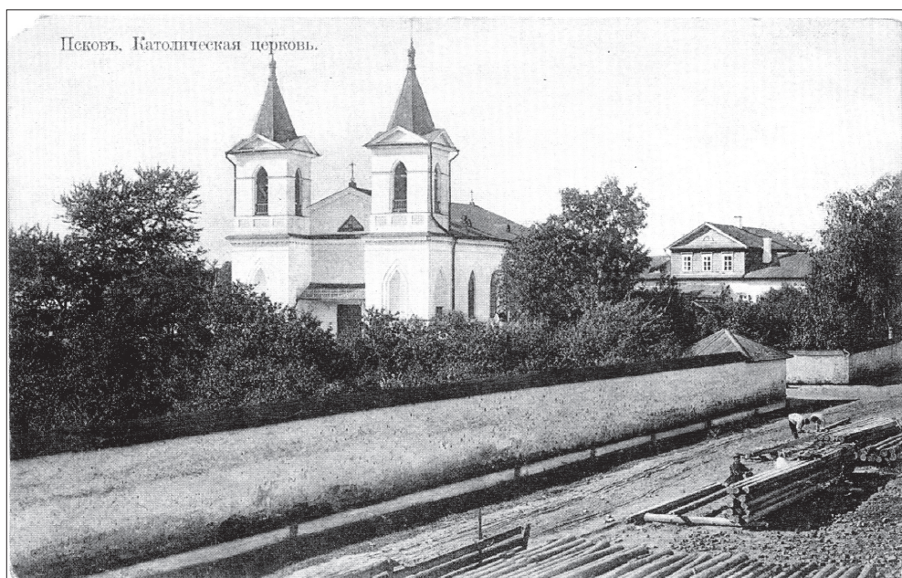
Псков. Католический костёл