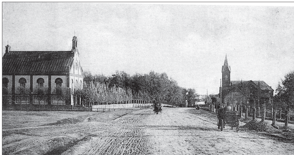
Остров. Слева — костёл, справа — кирха