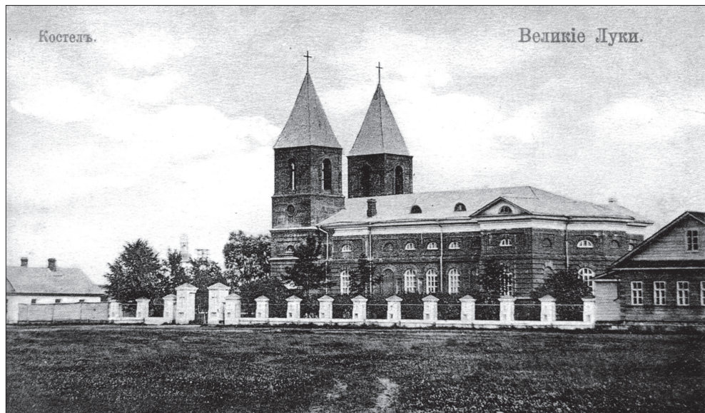
Великие Луки. Костёл