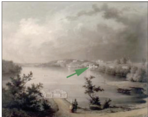
Винокуренный завод. 1855 г.