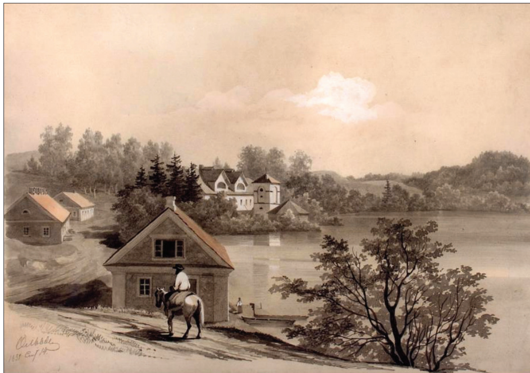
Винокуренный завод. Губокое. 1831г.