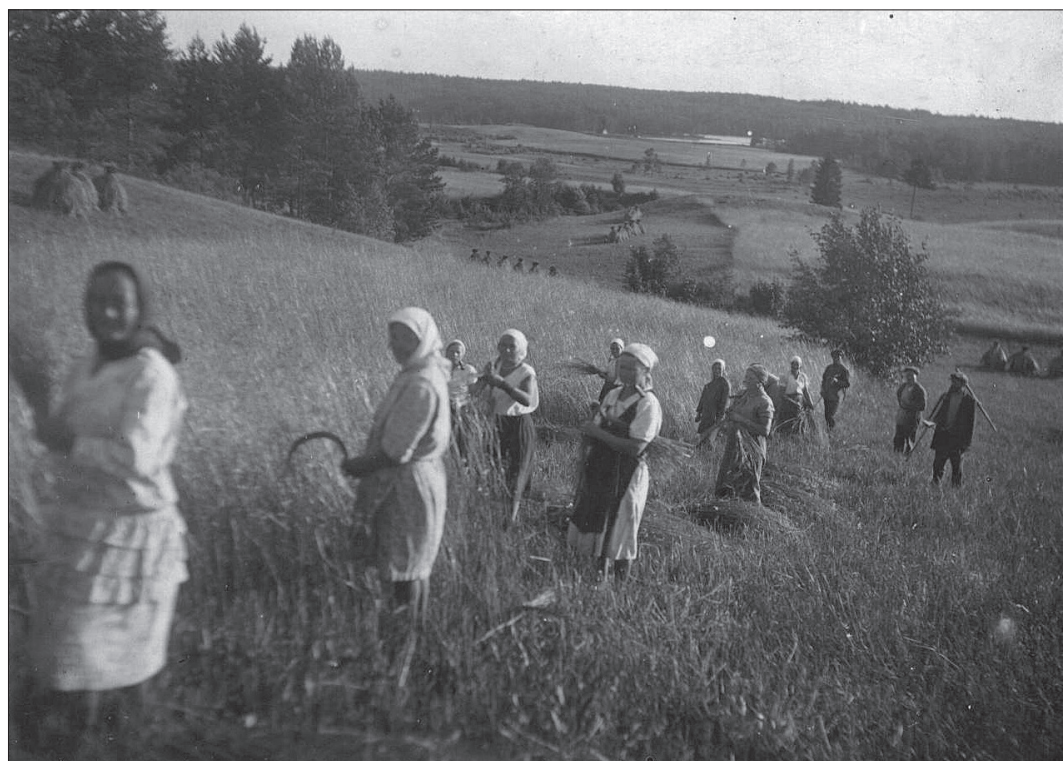
Колхоз «Большевик». Уборка урожая для спиртзавода