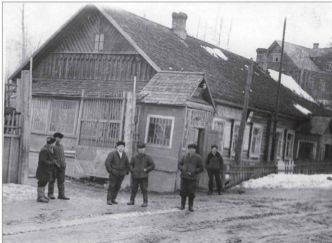
Здание второй конторы спиртзавода. 1956 г.