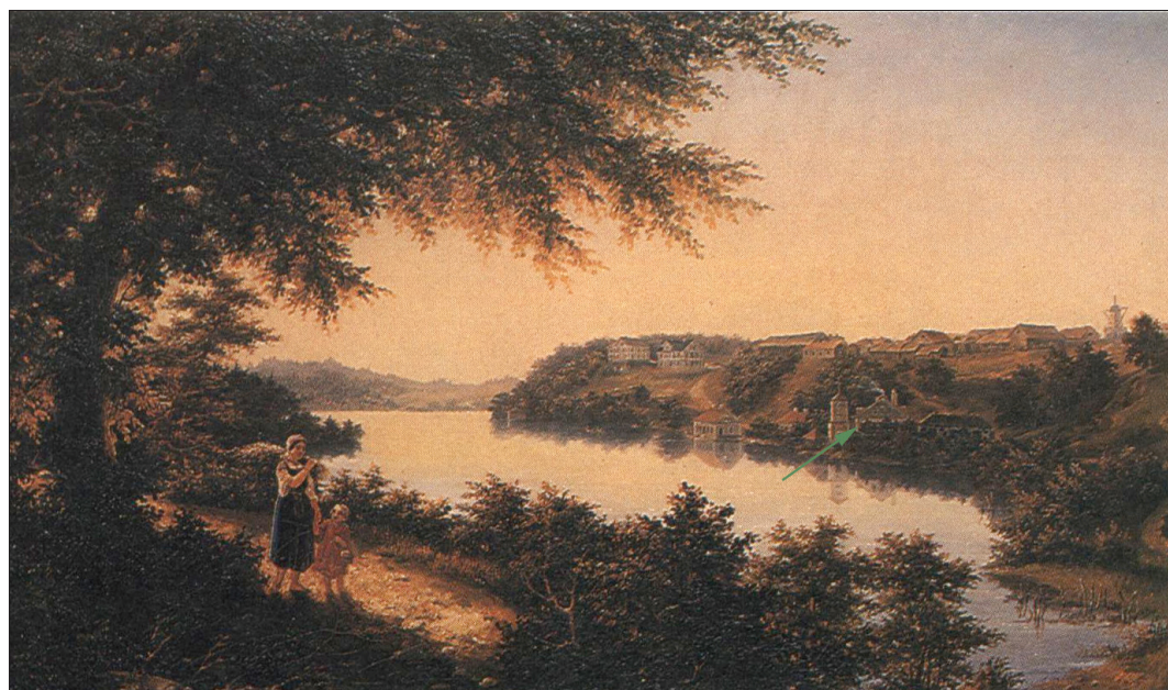
Винокуренный завод. Губокое. 1840-е годы