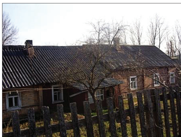
Многоквартирный дом для рабочих