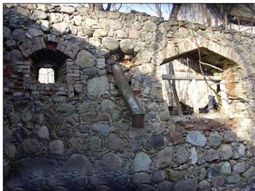
Труба для засыпки зерна в зернохранилище