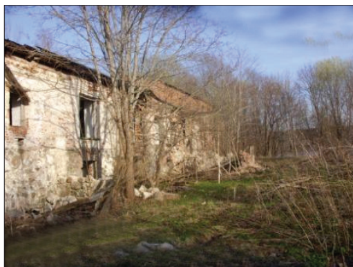
Современный вид бывшего спиртзавода