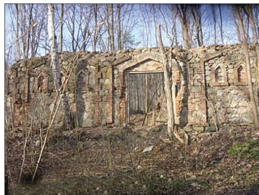
Зернохранилище спиртзавода. (Бывший фанерный завод. 19-н. 20 в.)