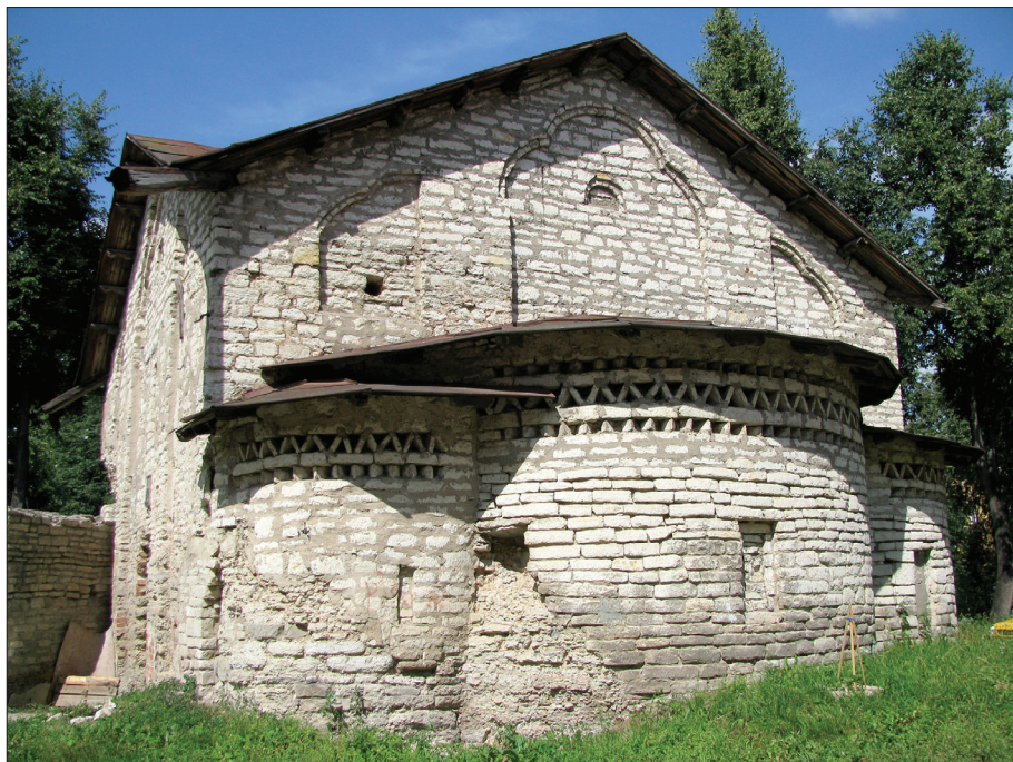
Монастырский храм Сергия с Залужья. Конец XVI в.