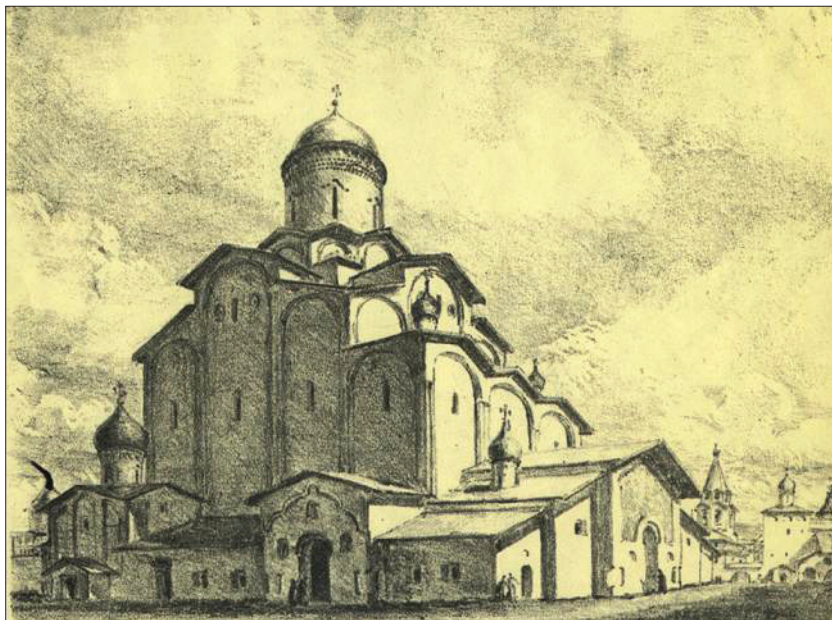
Троицкий собор в XVII в. Реконструкция Ю. П. Спегальского