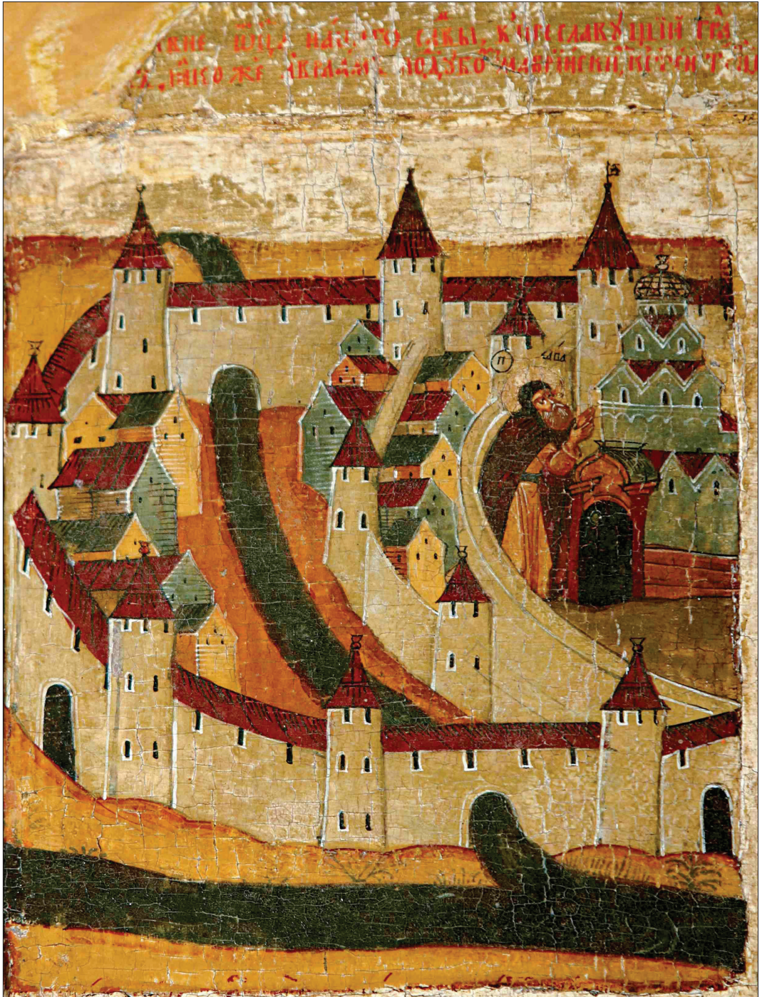
Вид Пскова и Псковского кремля на иконе «Избранные святые» нач. XVII в. из Крыпецкого Иоанно-Богословского монастыря