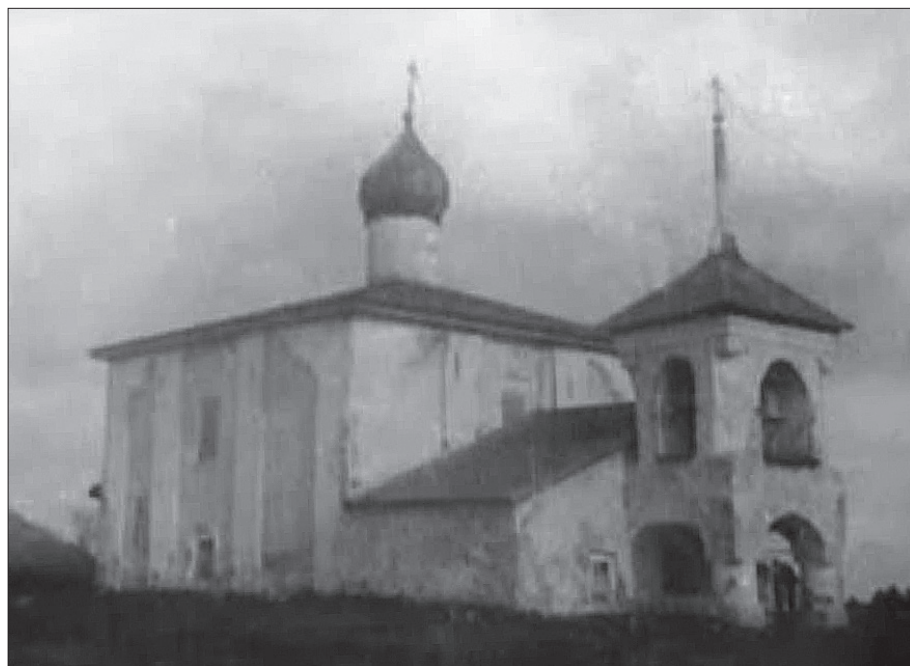
Церковь Козьмы и Дамиана на Гремячей Горе