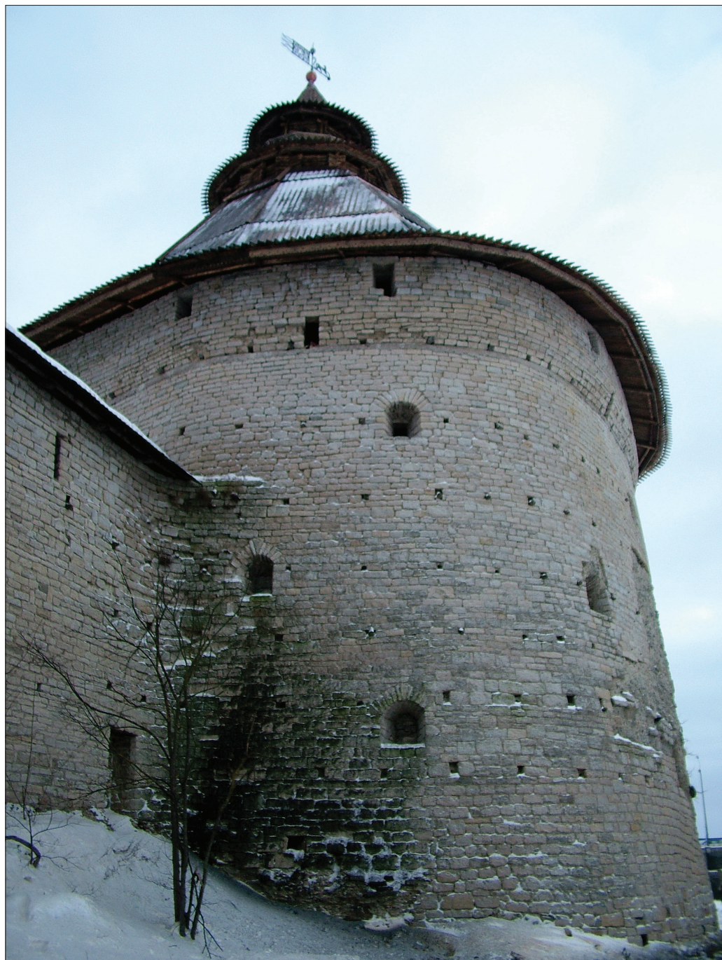
Покровская башня начала XVII в. (после восстановления)