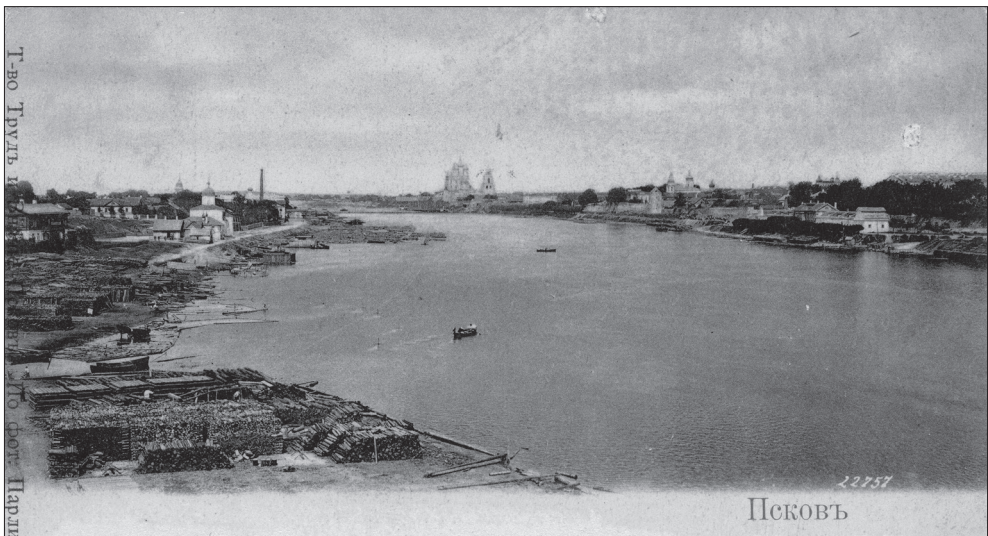
Вид р. Великой в сторону Лесозавода.

риод судоходства он фактически был отрезан от водного пути к Псковско-Чудскому озеру, зато был удобен для приема сплавного леса с верховьев Великой и имел более удобное расположение по отношению к железнодорожной магистрали, проходившей через Псков в Прибалтику. После строительства Ольгинского моста препятствие было устранено, и Торговый дом получил свободный выход в низовья Великой и озеро (как мы помним, еще ранее Д. В. Зиновьев был озабочен судоходством по Нарове).