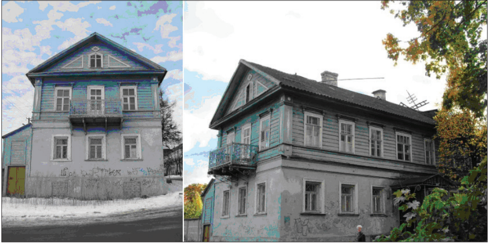
Здание биржи Торгового дома и конторы лесопильного завода Д. В. Зиновьева (до ремонта). Фото И. И. Лагунина 2011 г.

центре местных водных коммуникаций и в непосредственной близости от центра городской деловой активности, что играло большую роль в операциях с древесиной. Выбор места для предприятия оказался весьма перспективным. В городском ансамбле, в его речной акватории активными центрами пароходства и торговли были два места — под стенами Псковского кремля и у Торгового дома Д. В. Зиновьева. Обе зоны водной торговли разделялись до 1912 года наплавным мостом, что, наверное, имело значение и для Торгового дома. На пе-