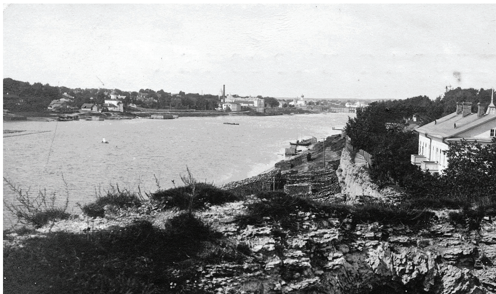
Вид в сторону завода с руин Покровской башни. С фототкрытки 1911 г.

Особенно интересны для нас здание лесозавода и дворовые пристройки к нему.