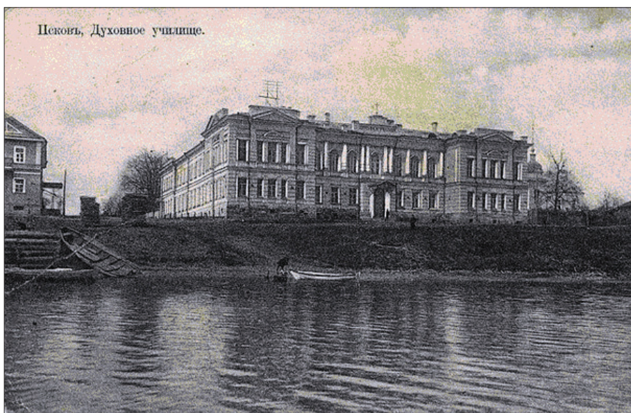
Слева здание Биржи-конторы Торгового дома Д. В. Зиновьева. С почтовой открытки начала XX в.