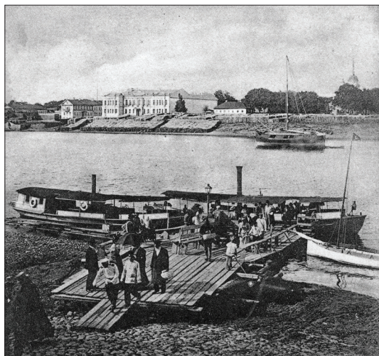
Вид на Завеличье и Биржу-контору Д. В. Зиновьева. С открыток начала XX в.

На более поздних фотографиях 1911 г. и последующих годов видно, что акватория Великой расчищена от сплавного леса, мостков, купален и др. подобных сооружений, загромадивших русло реки. Очевидно, вышел запрет на подобные действия. Панорама реки преобразилась. Зато по берегам и на Завеличье появились сплошные линии дровяных штабелей, начиная от Лесопильного завода и до Ольгинского моста. В районе завода это были крупные штабеля бревен, а на территории завода и Торгового дома — готовой и деловой древесины.