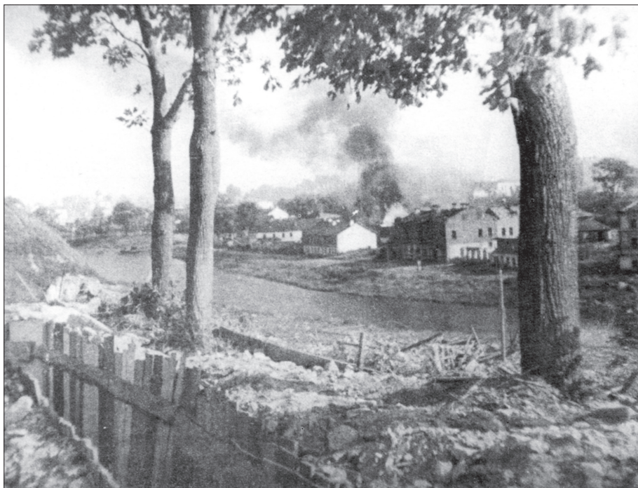
Горит Запсковье ...