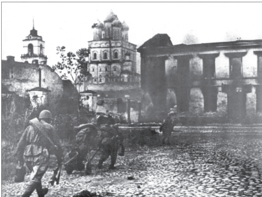
Уличные бои в Пскове. Июль 1944 г.