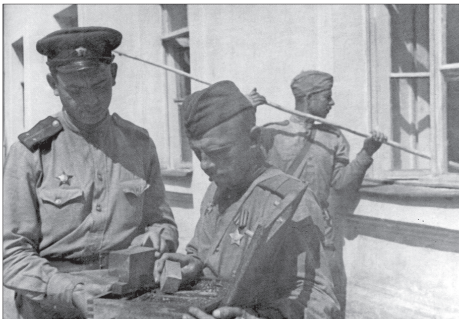
Сапёры очищают Псков от мин