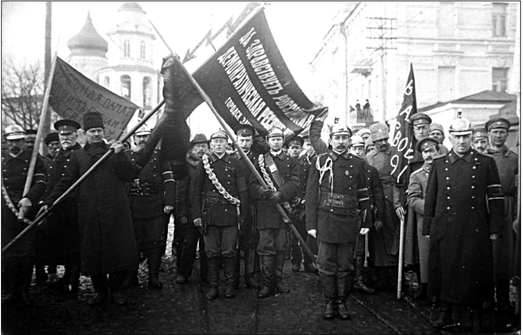
Колонна пожарных на ул. Великолуцкой. Псков, 23 марта 1917 г.