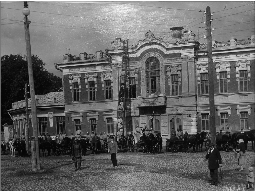
Псковская городская пожарная команда на площади перед театром. 1922 г.