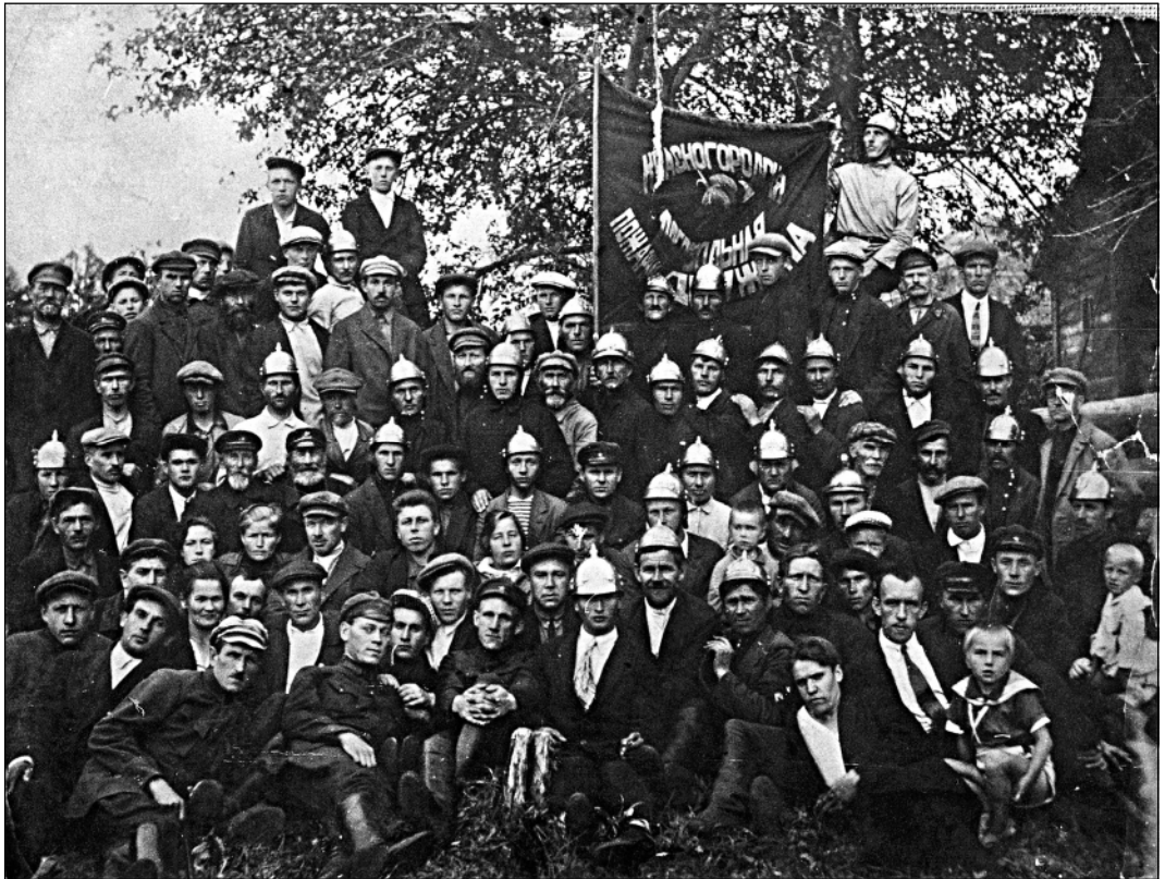
Красногородская добровольная пожарная дружина. 1932 г.