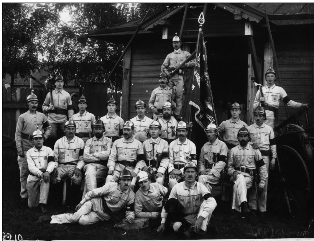
Железнодорожная пожарная команда. Псков, 1926 г.