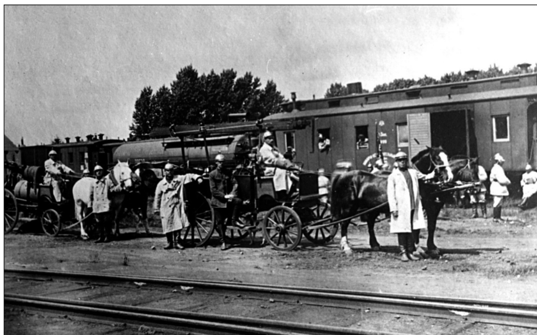
Дновская ж. д. пожарная команда. 1930-е гг.