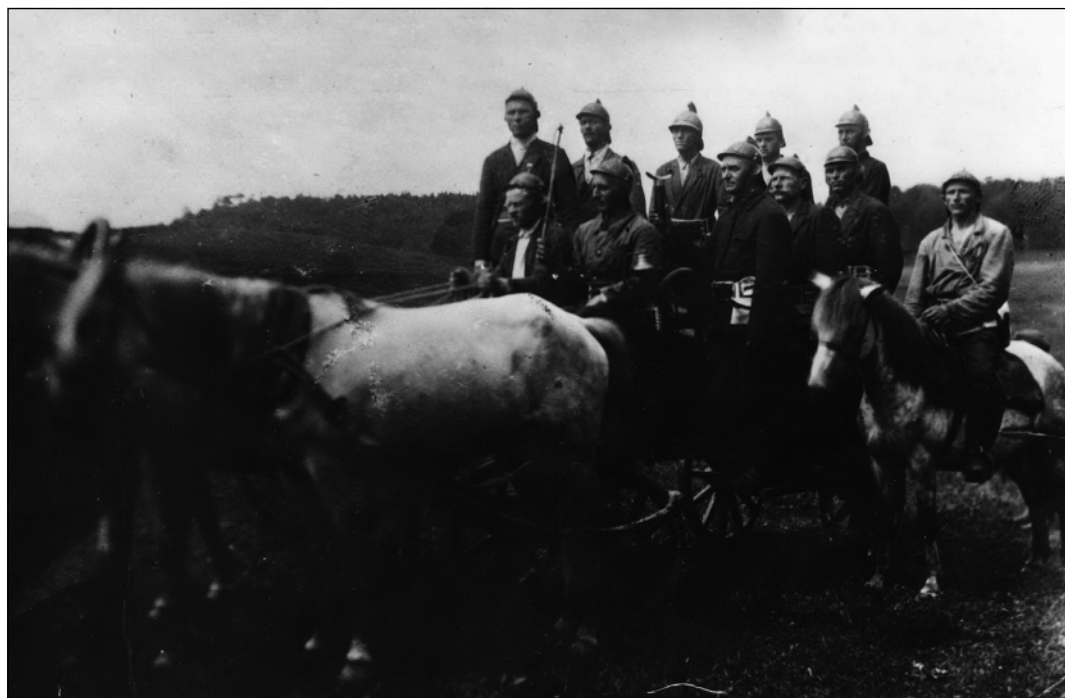
Пушкиногорская пожарная команда. 1934 г.