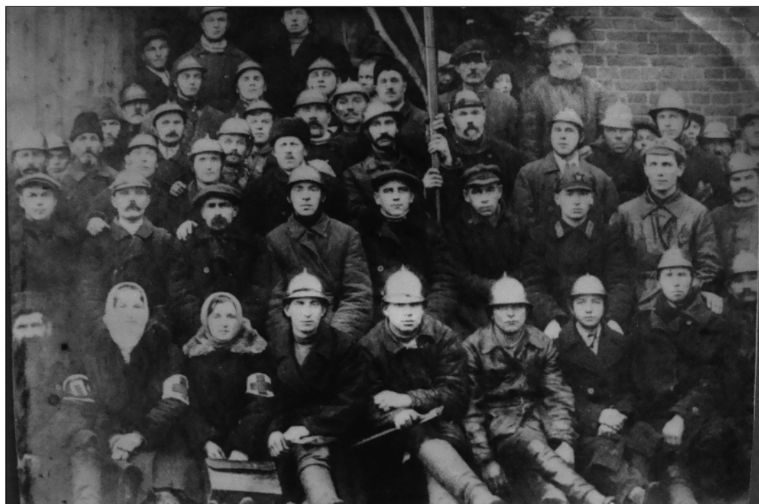
Усвятская пожарная команда. 1926 г.