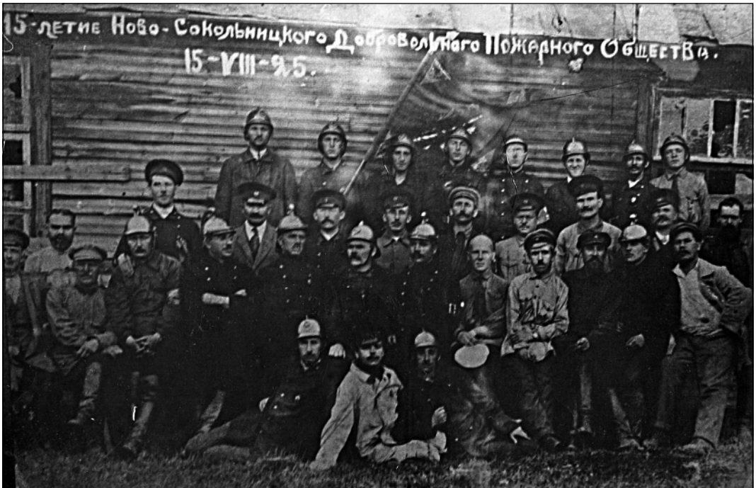
Новосокольническая пожарная команда. 1925 г.