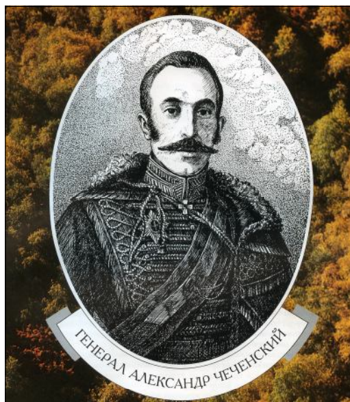
Чеченский А.Н. Худ. С. Бицраев. 1998