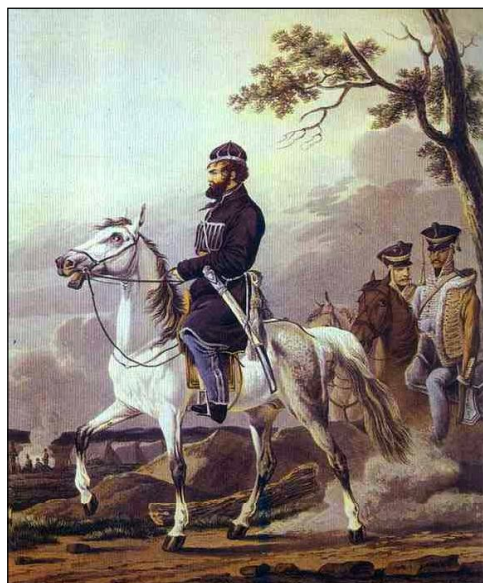
Орловский А.О. Портрет Дениса Давыдова. 1814. Первый справа - Чеченский