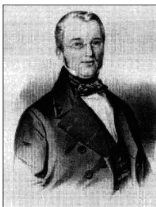
А.Д. Петров. (1794–1867)