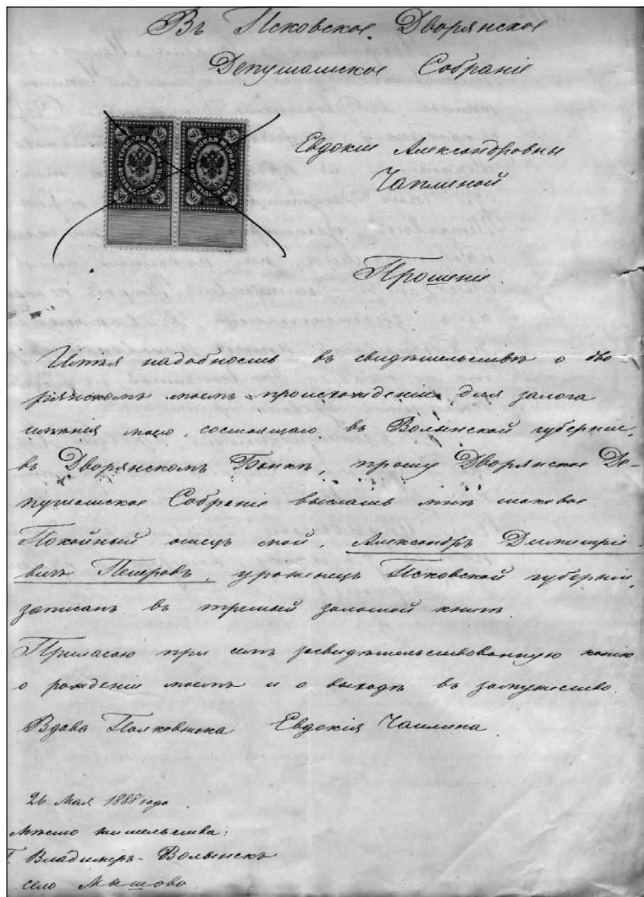
Прошение Е.А. Чаплиной в Псковское дворянское депутатское собрание. 26 мая 1888 год. ГАПО. Ф. 110. Оп. 1. Д. 743. Л. 32.