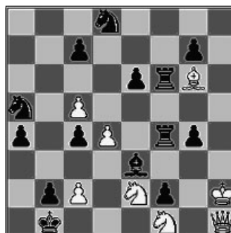
Шахматная задача А.Д. Петрова «Бегство Наполеона из Москвы в Париж»