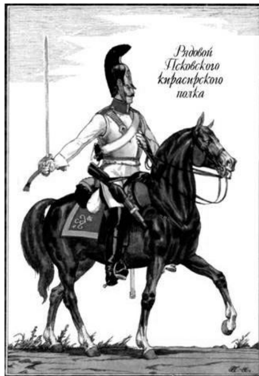
Рядовой Псковского кирасирского полка