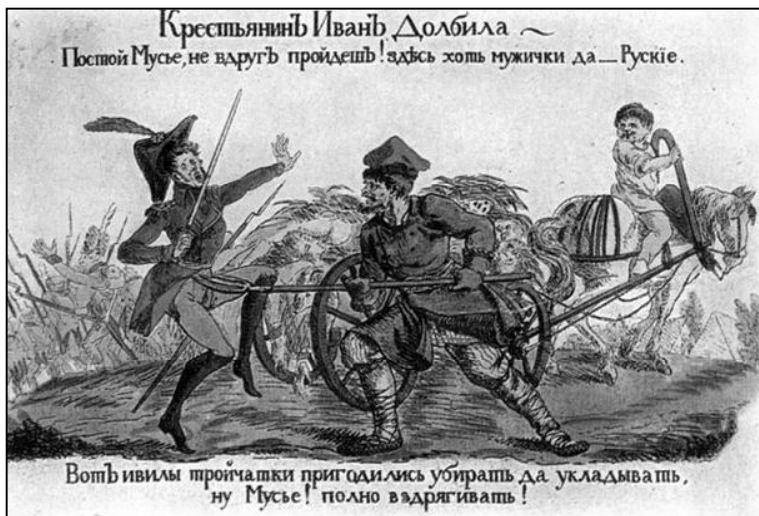
Открытка 1812 года