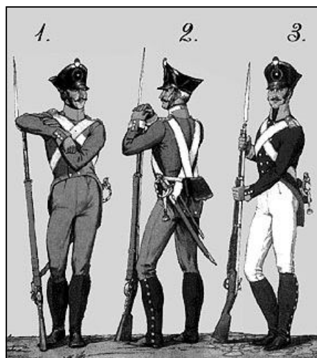
Унтер-офицеры внутренней стражи