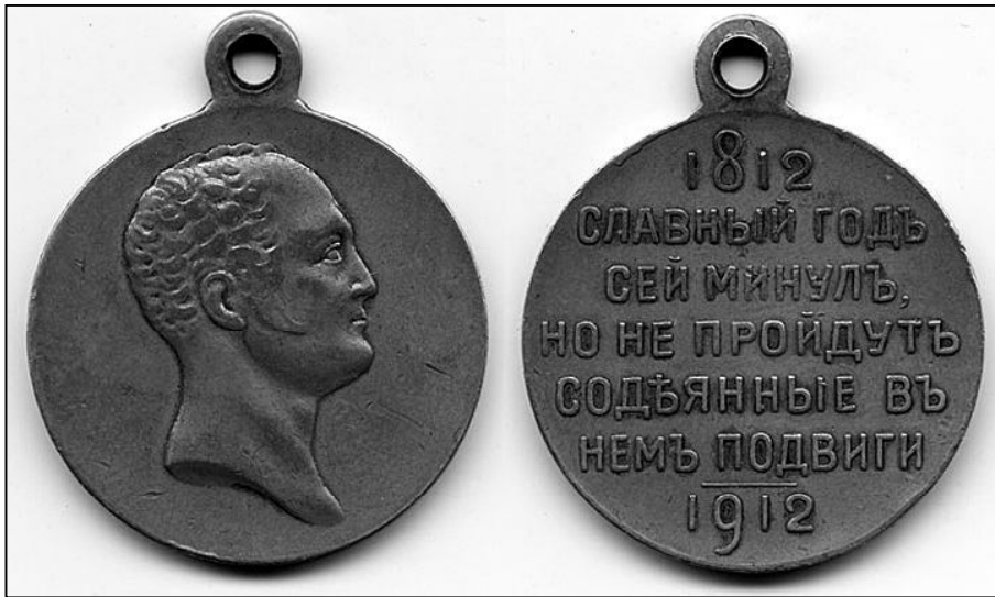
Медаль 100 летия войны 1812 года