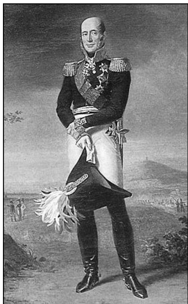
Барклай де Толли. Картина Дюу