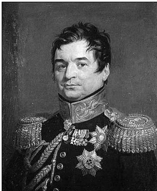
Министр полиции А.Д. Балашов