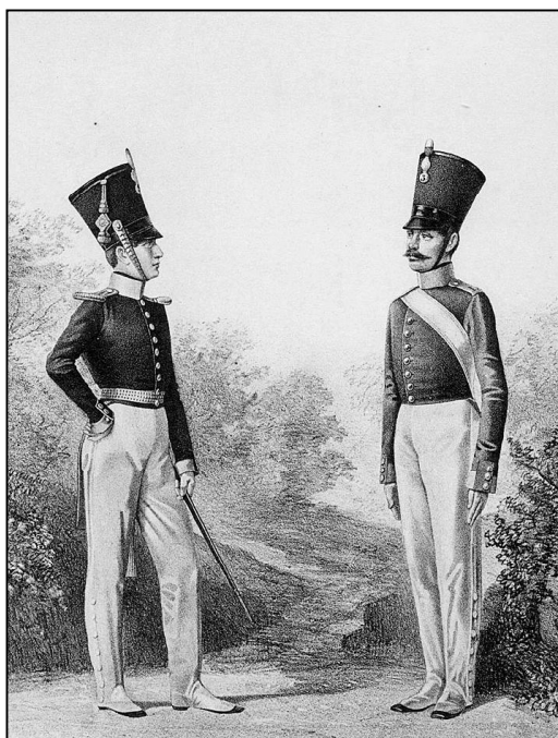
Военнослужащие внутренней стражи