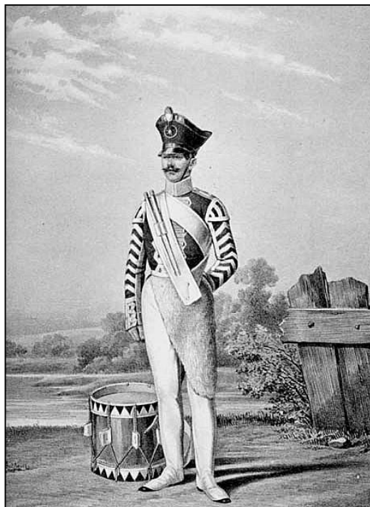
Барабанщик внутренней стражи 1816 год