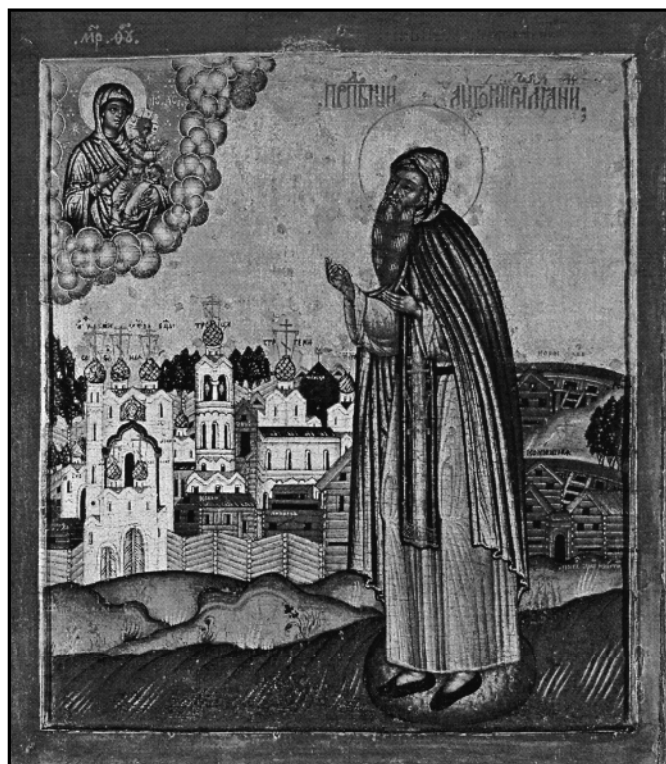
Св. Антоний Римлянин. Икона XVI века.