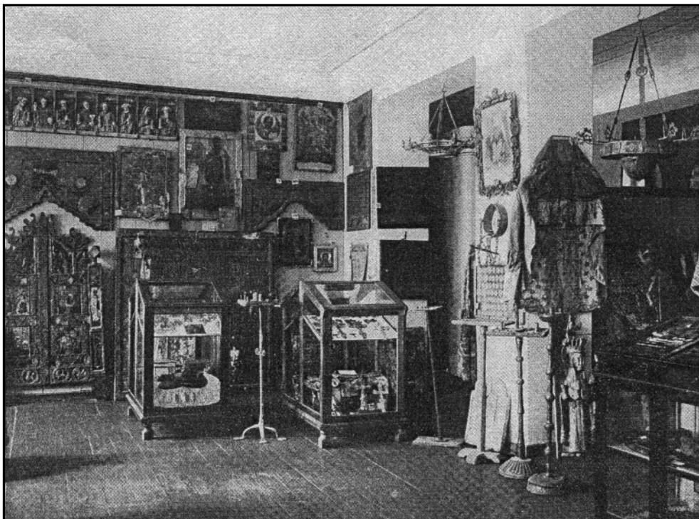
Экспозиция музея Псковского церковного историко-археологического комитета.