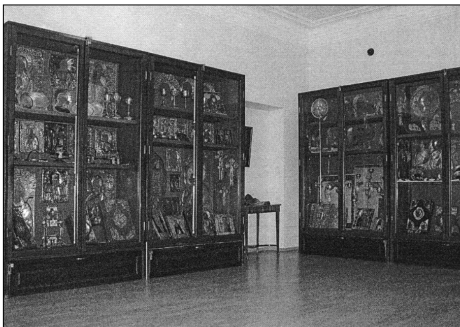
«Золотая кладовая» (открытое хранилище драгоценных металлов и камней).