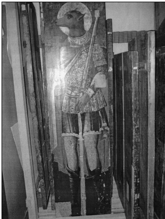
Св. Христофор с пёсьей головой. Икона XVIII в.