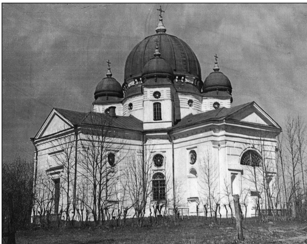
Вознесенская церковь в Бельском Устье