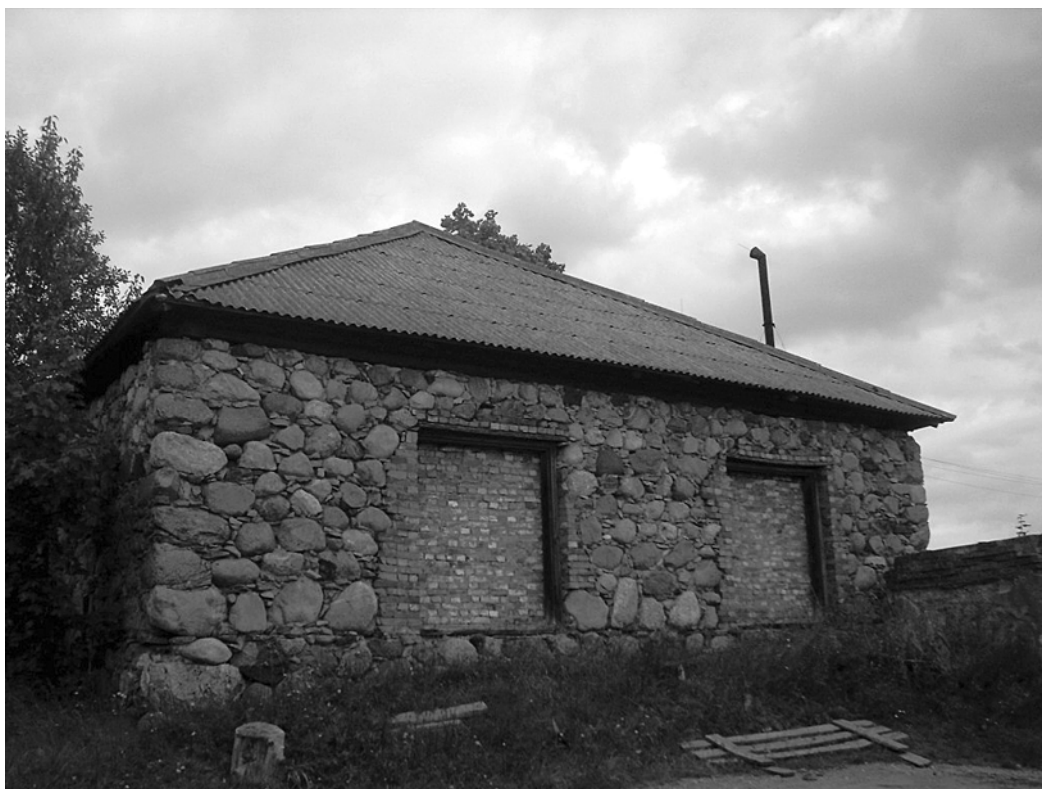
Остатки построек имени Щукино. Современное фото