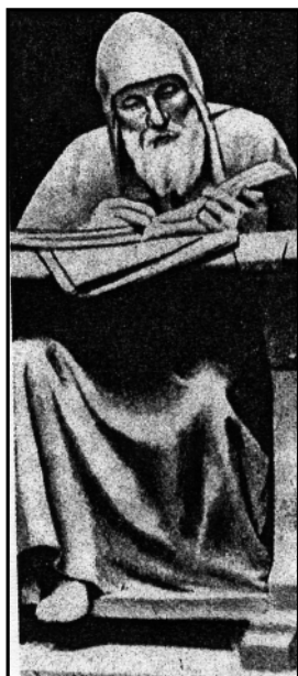
Составитель «Повести временных лет»