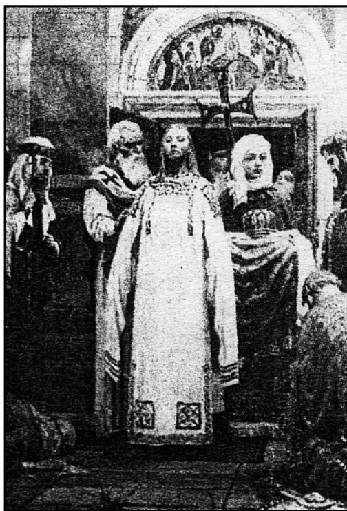
Крещение кн. Ольги в Константинополе. Худ. С. Кириллов.

В очередной раз летопись пишет об Ольге под 955 г., через десять лет после гибели Игоря: она ехала в Константинополь, который на Руси называли из-за величины и могущества Царьградом. Ехала как частное