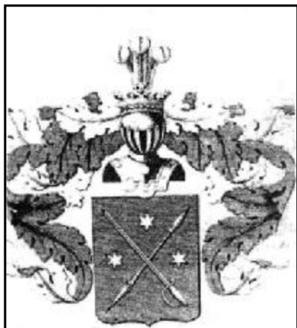
Герб дворянского рода Калитиных