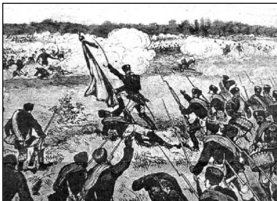
Подвиг подполковника Калитина. (Рисунок неизвестного художника)