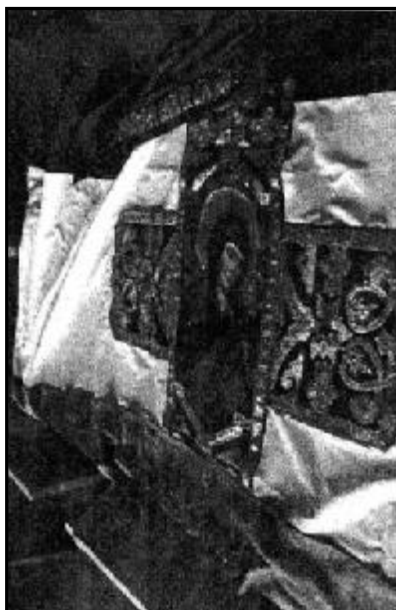
Самарское знамя. Копия ручной работы, выполненная по проекту худ. Д. Генова. Холм. Краеведческий музей. 2007 г.