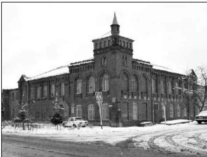
Бывшее Опочечкое реальное училище

В наши дни в здании бывшего реального училища размещается Опочечская средняя школа № 1. Абрам Кикоин, младший брат Исаака, в письме ко мне из Свердловска от