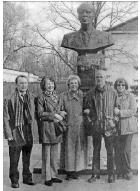
У бюста И. К. Кикоина

Эти воспоминания о псковском прошлом и дружеское общение с псковичами привели к тому, что он высказал желание, чтобы бронзовый бюст, который обычно устанавливался на родине дважды Героя Социалистического