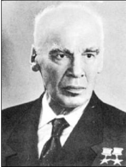
Кикоин И. К.

начал работать в ленинградском Физико-техническом институте, в стенах которого открылись его способности блестящего экспериментатора.