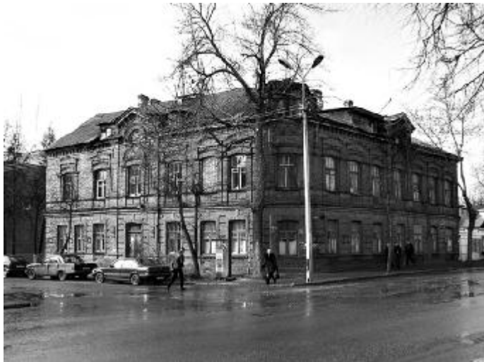
Дом №31 по Советской улице