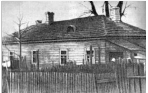
Псков, ул. Калинина, 9

В Пскове первые восемь лет Кикоины снимали часть небольшого деревянного, обшитого досками дома № 9 по Успенской, переименованной вскоре, в 1923 году, в улицу Калинина. Почти рядом, в доме № 5 по Успенской улице, находилось угловое трёхэтажное каменное здание 1-й школы. Между ними располагался детский дом имени наркома социального обеспечения А. Н. Винокурова. Домовладения №№ 7 и 9 исчезли во время последней войны, и сейчас это место занимает школьная спортивная площадка.