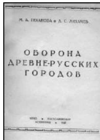
Титульный лист книги