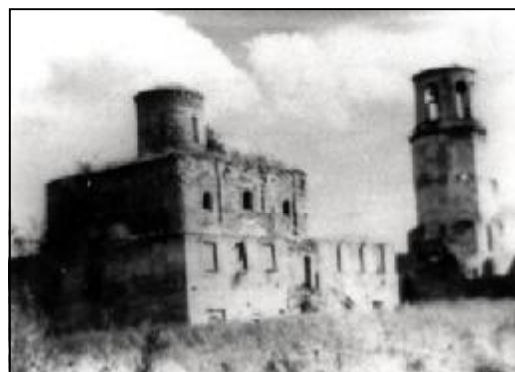
Крыпецкий монастырь. 1991 г.