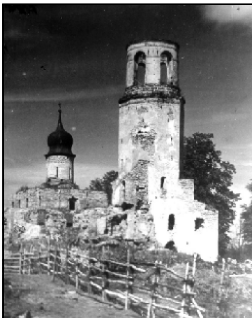
Крыпецкий монастырь. Фото ок. 1960 г. из архива Ю. П. Спегальского.