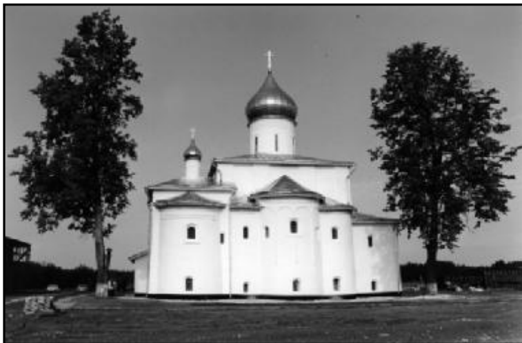
Иоанно-Богословский собор Крыпецкого монастыря. 2001 г.