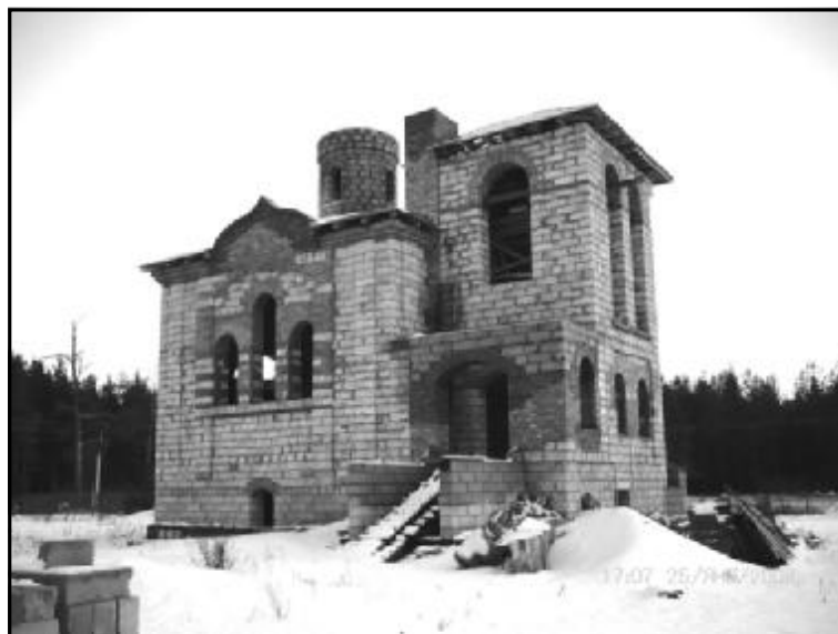
Строящийся храм в с. Торосино. Фото 2008 г.