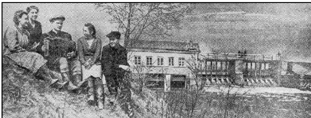
Группа строителей около Торшинской ГЭС. Фото 1954 г.