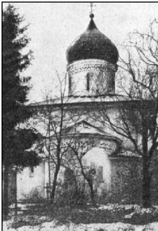
Ильинская церковь погоста Торошино. Довоенное фото И. Н. Ларионова.