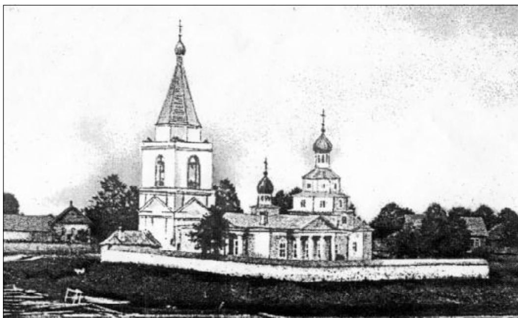
Гдов. Пятницкая церковь.