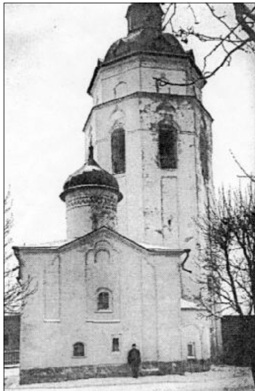
Гдов. Успенская церковь и колокольня.

По данным писцовых книг, в стенах и башнях Гдовской крепости насчитывалось 207 бойниц, в том числе 122 крупных - для пушек и 85 - для пищалей. На момент переписи по башням и захабам были расставлены 24 пушки, из которых 5 - крупного калибра, стрелявшие ядрами весом до 8 фунтов (более 3 кг), две пушки - дробовые: заряжались крупной дробью для поражения живой силы врага. Писцы зафиксировали также 5 скорострельных пищалей и одну «сороковую», видимо многоствольную, 50 затинных пищалей - тяжелых крепостных ружей. Пороха имелось более 246 пудов и 77 пудов свинца. 60 Таким образом, Гдов снова был готов к борьбе, но судьба перенесла ее на следующий век.