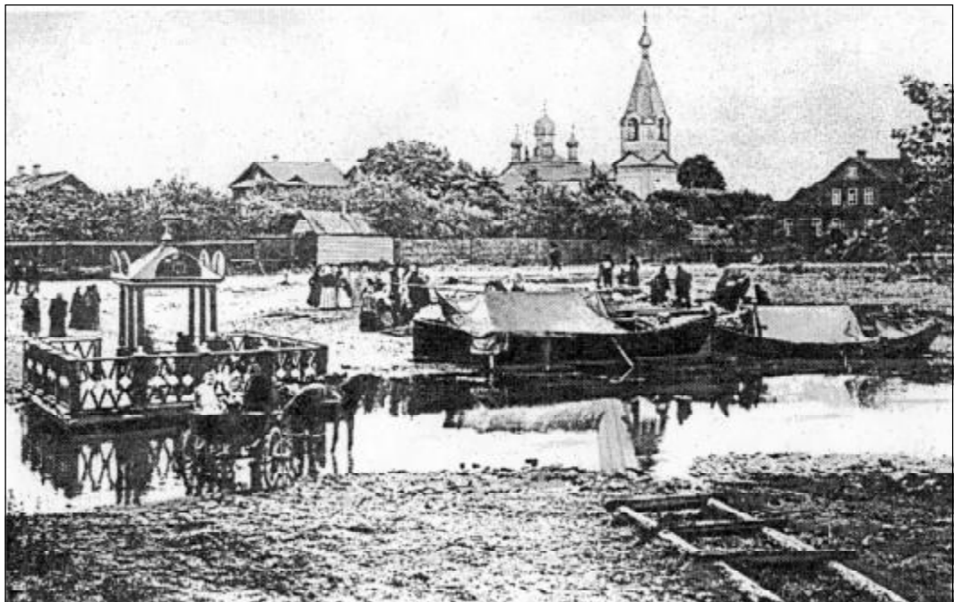
Гдов. Вид Афанасьевской церкви. До 1764 г. - монастырь.