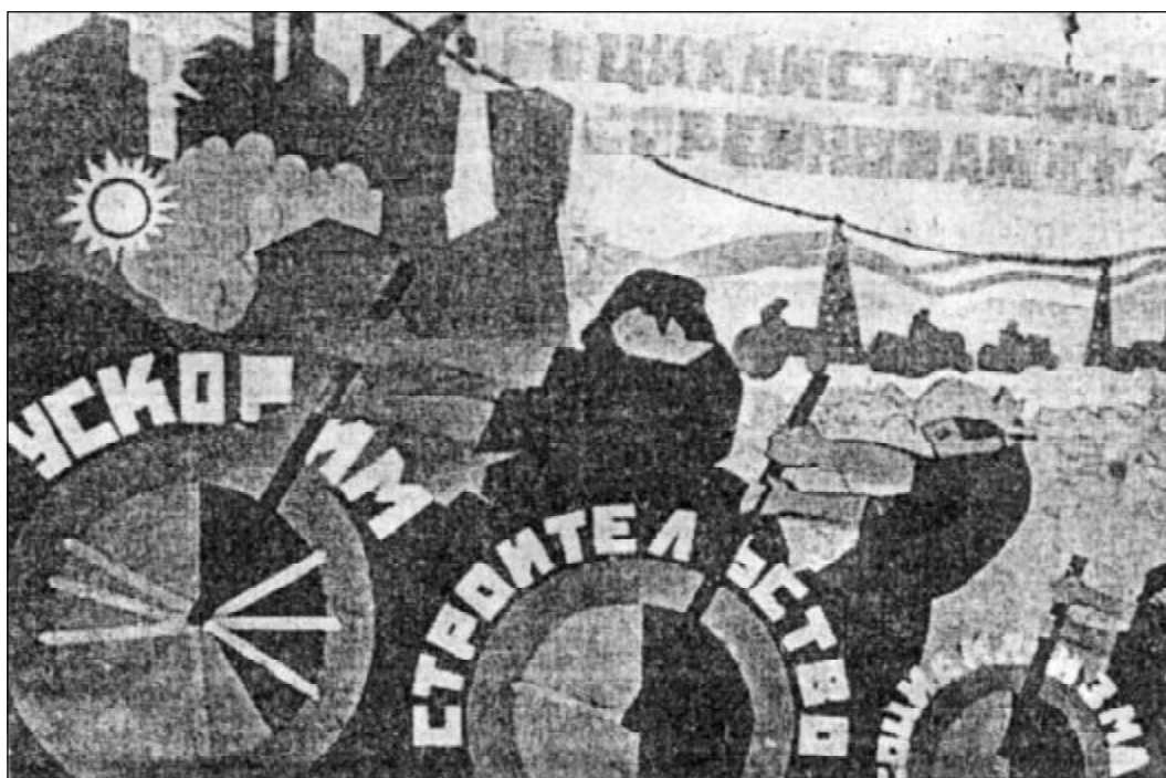
Пример агитационно-массового искусства. Плакат В.К.Турбасова для одного из рабочих клубов (нач. 20-х гг. XX в.).