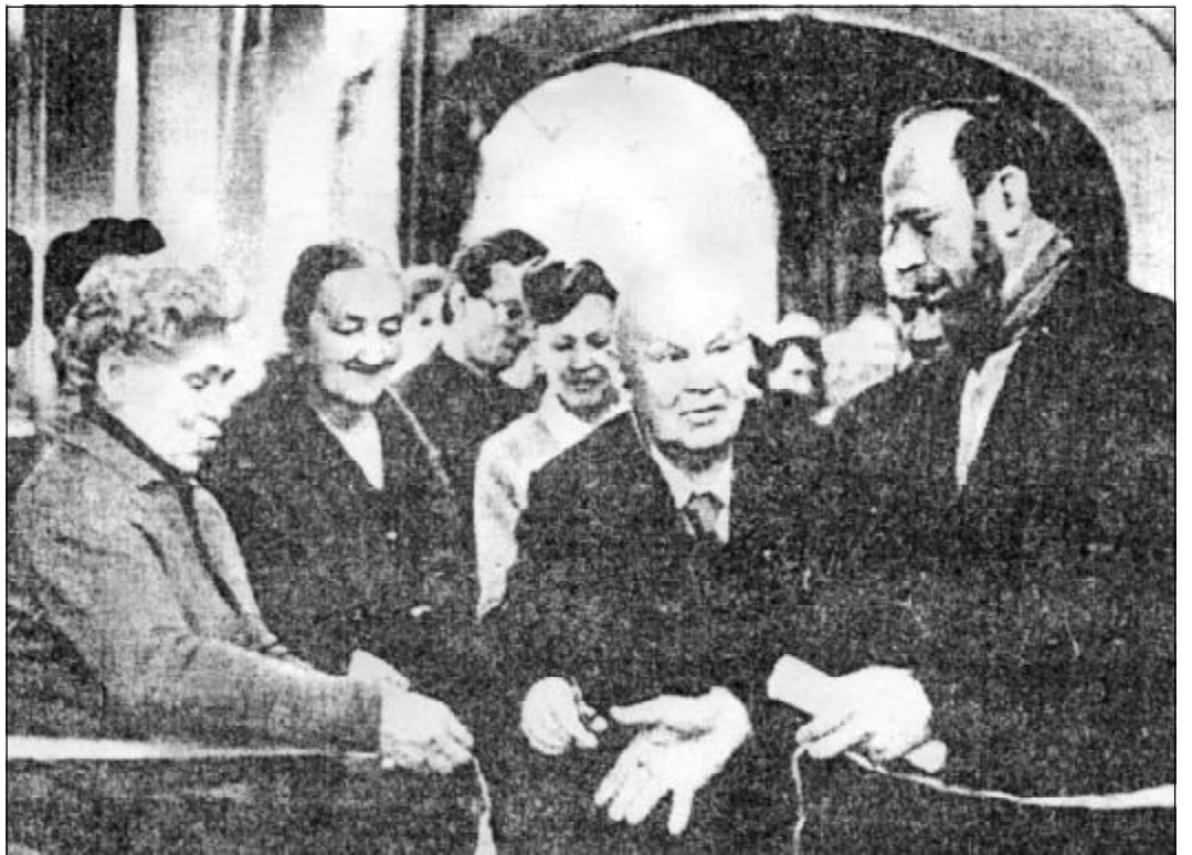
Открытие выставки В.К. Турбасова в Ленинграде. 1985 г.