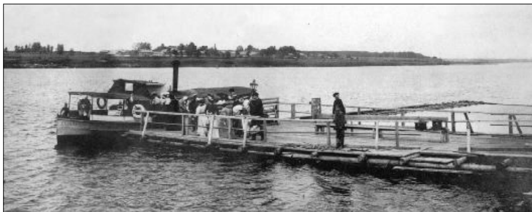
Параходное сообщение Псков-Корытово-Черёха.