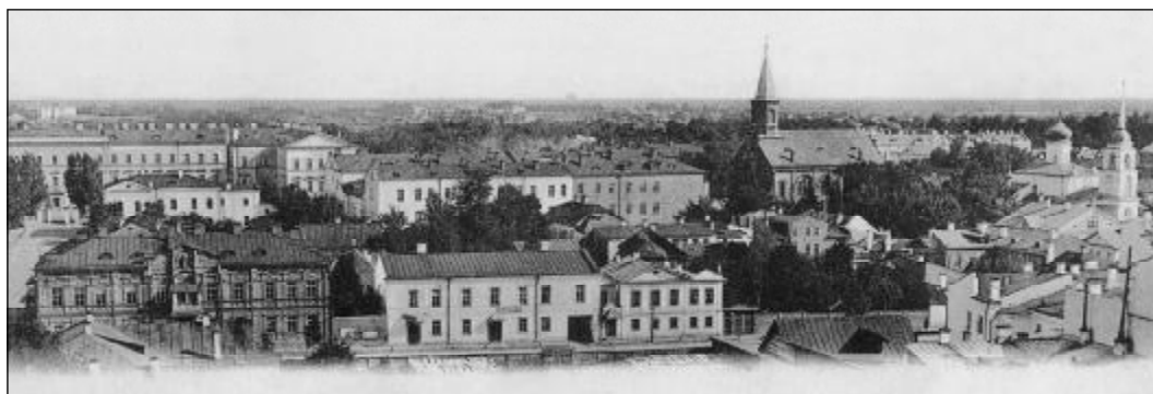
Дом купца Аристова (отмечен стрелочкой), ул. Пушкинская.