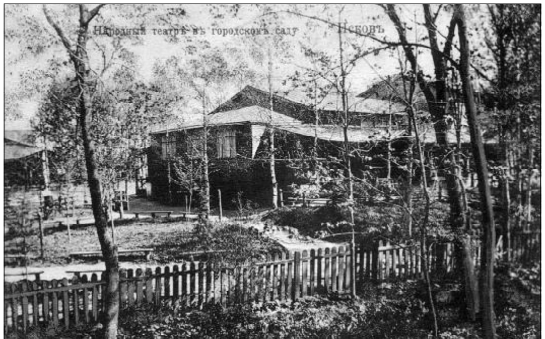
Народный театр въ городскомъ саду Псковъ