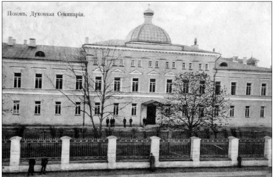
Псковъ, Духовная Семинарія.