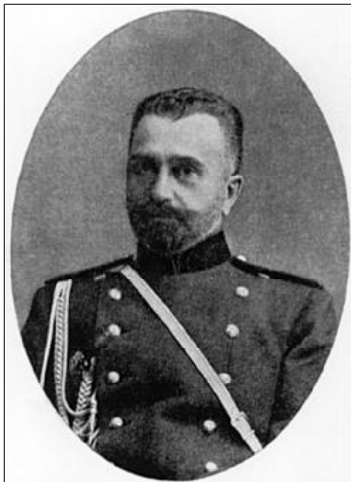
Ю. Н. Данилов (1866-1937). В июле 1914 - августе 1915 - генерал-квартирмейстер штаба Верховного Главнокомандующего, с августа 1916 по апрель 1917 - начальник штаба Северного фронта.