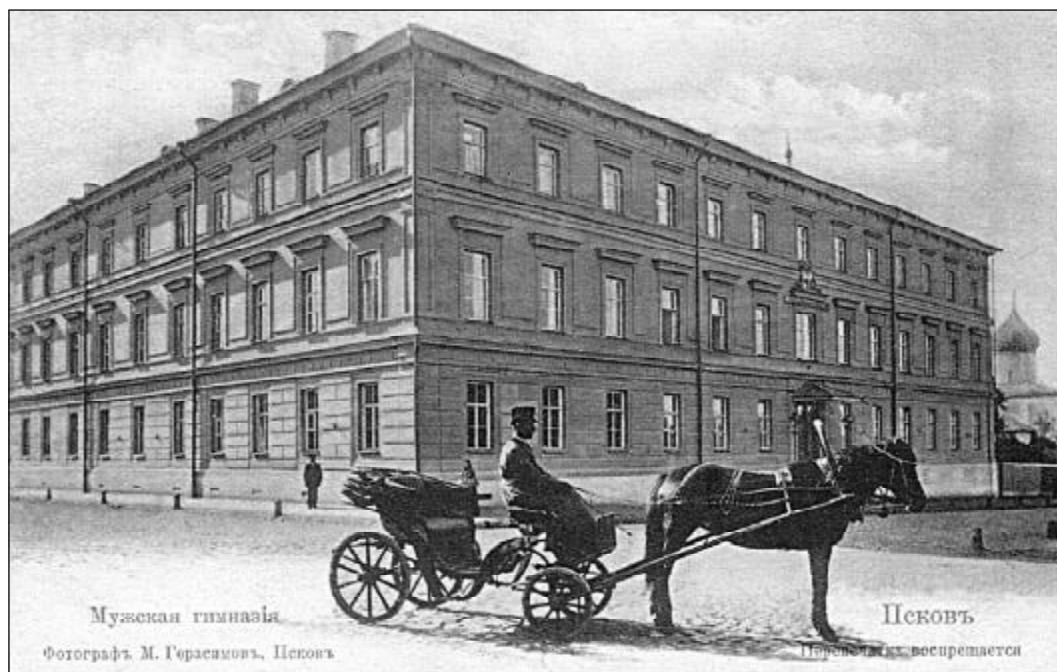
Здание Мужской гимназии в г. Пскове, где находился штаб Северного фронта и КРО фронта.