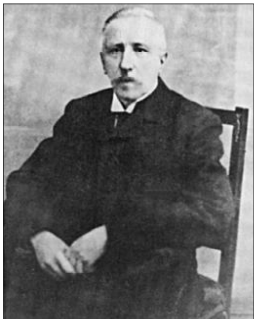
П. Г. Курлов (1860-1923). С 1909 по октябрь 1911 г. - товарищ министра внутренних дел, с ноября 1914 по август 1915 г. - особо уполномоченный по гражданскому управлению Прибалтийскими губерниями.