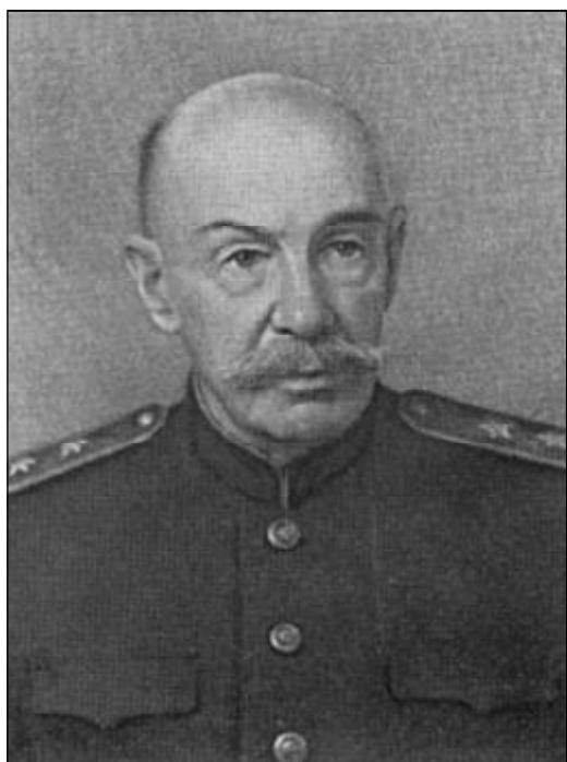
М. Д. Бонч-Бруевич (1870-1956). С октября 1914 г. - генерал-квартирмейстер штаба Северо-Западного фронта, с апреля 1915 г. - начальник штаба 6-й армии, до февраля 1916 г. - начальник штаба Северного фронта. С марта 1916 г. - начальник гарнизона Пскова.