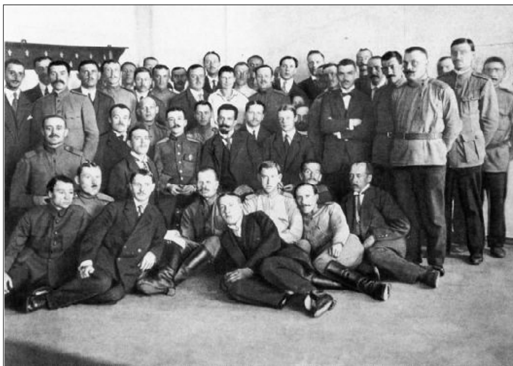
Группа контрразведчиков штаба Северного фронта. 1917 г.