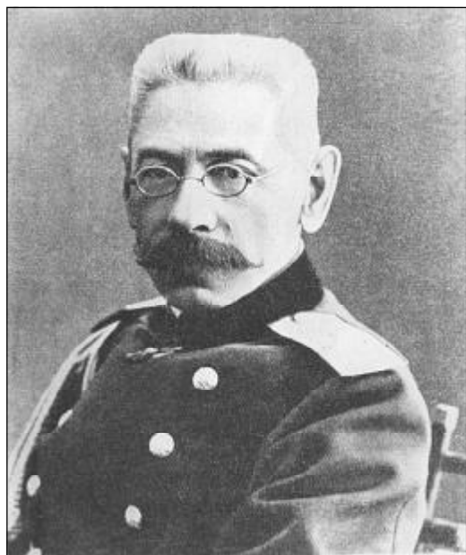
Н. В. Рузский (1854-1918). В 1914-1915 гг. - командующий Северо-Западным фронтом, с августа по декабрь 1915 и с августа 1916 по апрель 1917 гг. - командующий Северным фронтом.