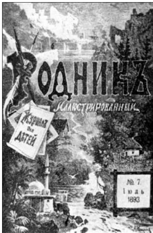
«Родник», иллюстрированный журнал для детей.