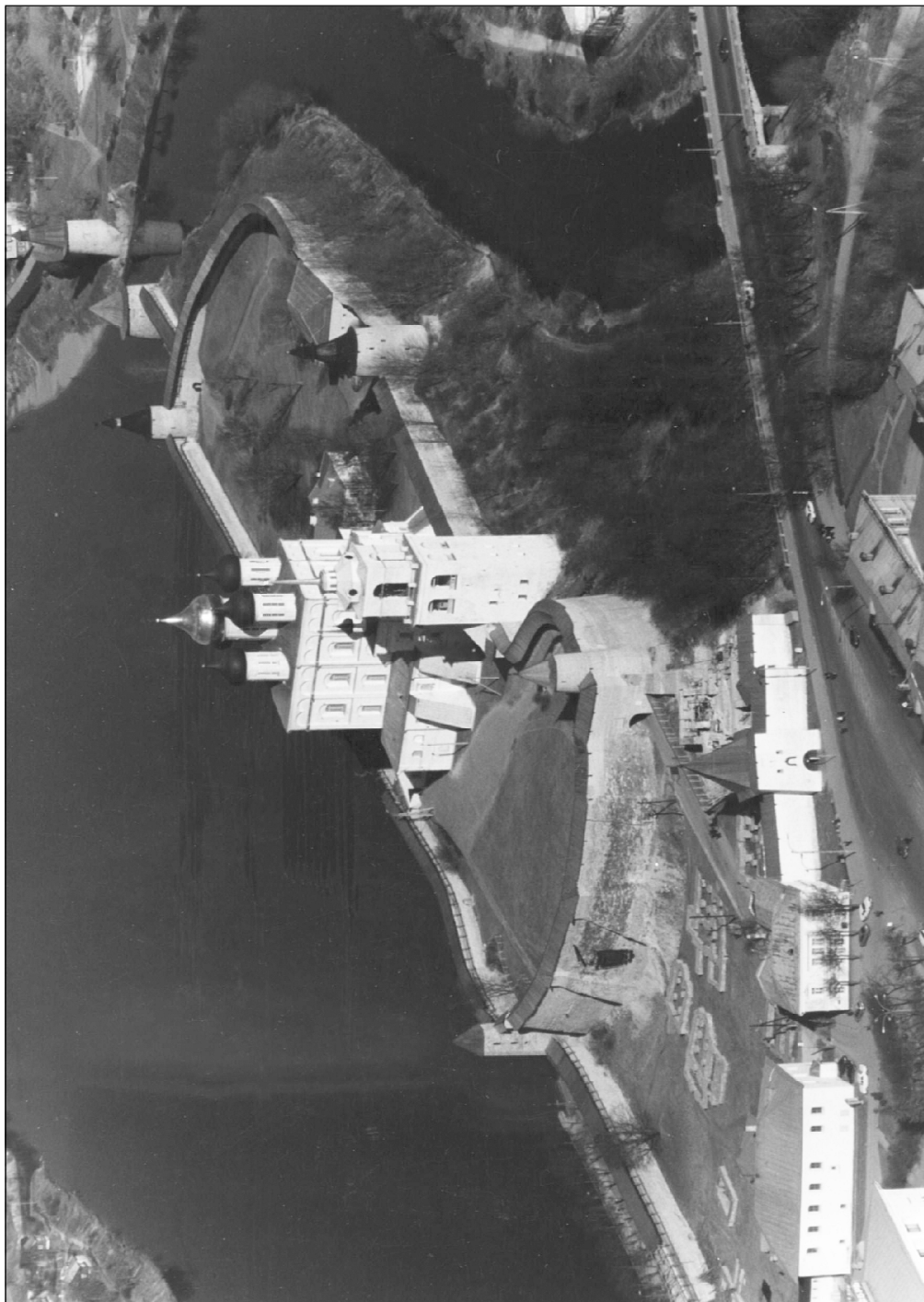
Псковский Кремль. Место зарождения города.