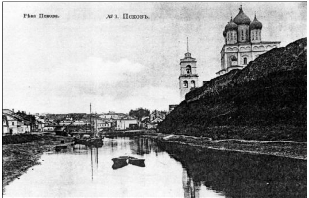
Восточный склон кремлевского холма. С открытки начала XX века.