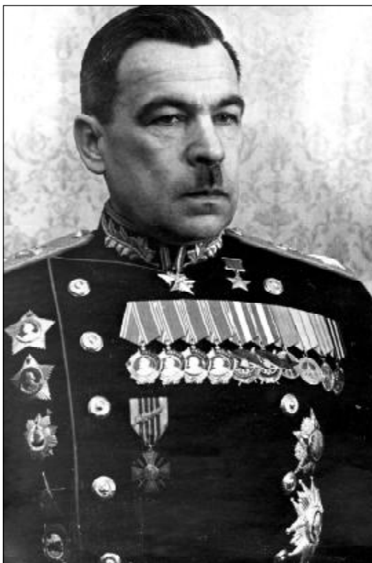
Л.А.Говоров - маршал, командующий войсками Ленинградского фронта с июня 1942 г.