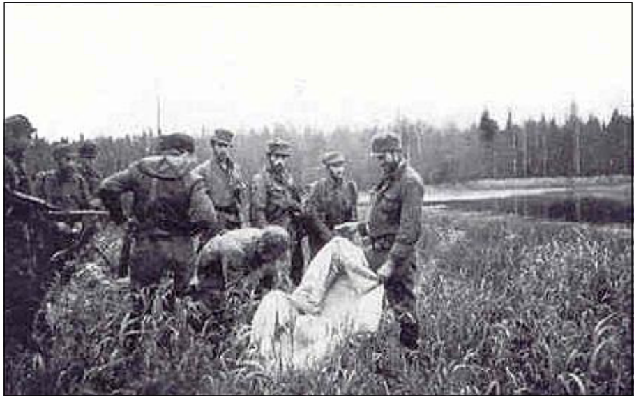
Группа немецких диверсантов после приземления в советском тылу. 1944 г.