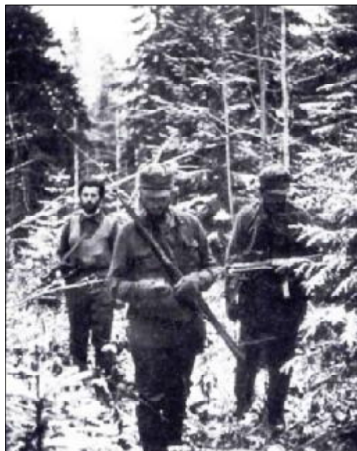
Немецкие диверсанты. 1944 г.