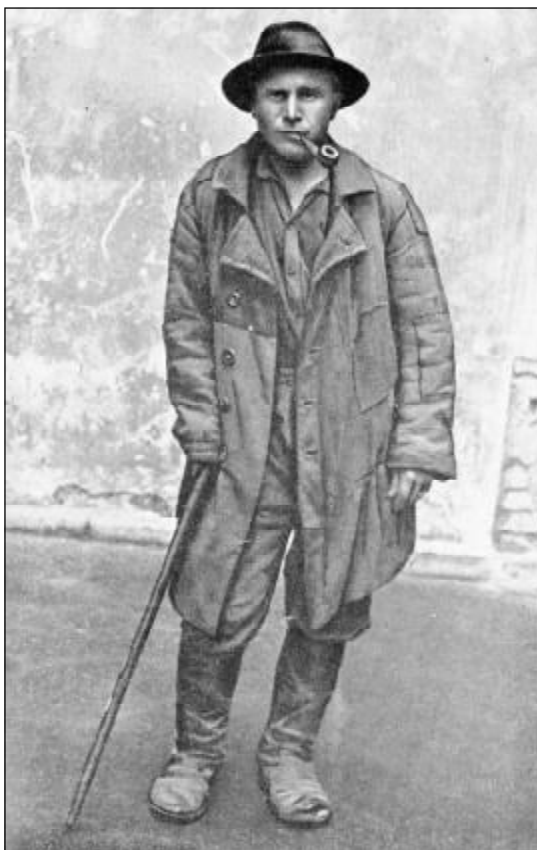
Советский разведчик Б.А. Соломатов при выходе из немецкого тыла. Фотография 1944 года.