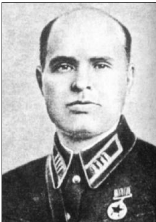
М.Ф. Орлов. Командир ОМСБОН НКВД СССР.