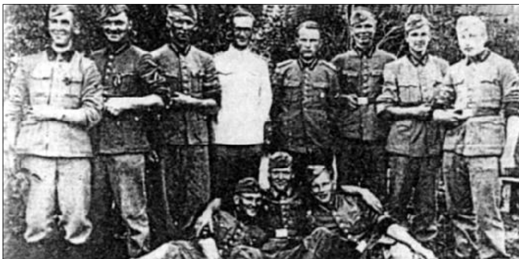
Каратели из латвийского schuma-батальона. Фотография 1943 года.