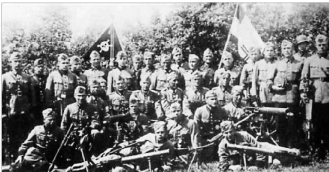
Подразделение латвийского schuma-батальона. Фотография 1943 года.