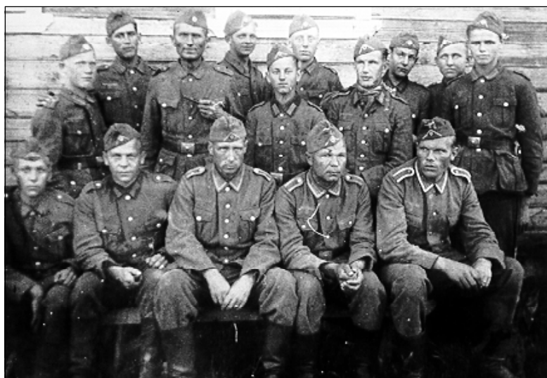
Каратели отдельного эстонского взвода тяжелых пулеметов.