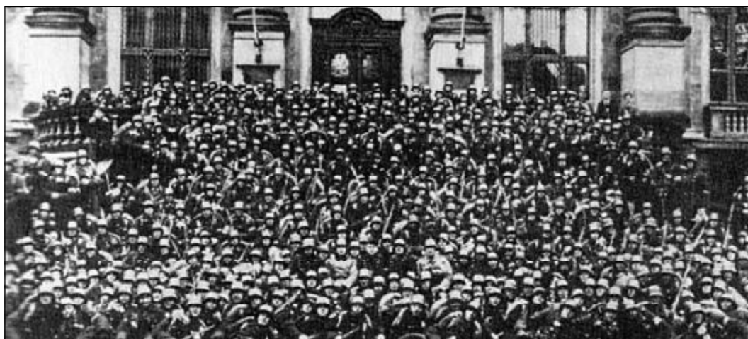
Латвийский Земгальский schuma-батальон. Фотография 1942 года.