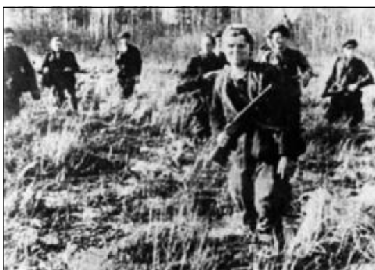
Члены Объединения латвийских партизан.