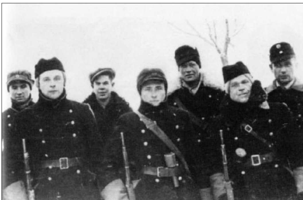
Один из первых отрядов вспомогательной полиции (schuma). Зима 1941-1942.