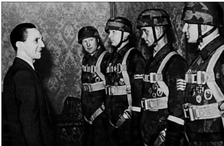
Й. Геббельс награждает бойцов разведывательно-диверсионного подразделения СС.