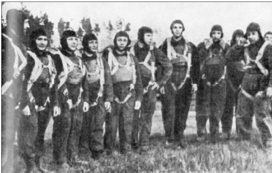
Партизанский отряд перед отправкой в тыл врага. Фотография 1943 года.