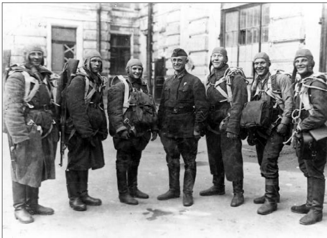
Партизанский разведывательный отряд УНКВД перед отправкой в немецкий тыл. Ленинград, 1943 год. (Из фондов ГАНИПО).