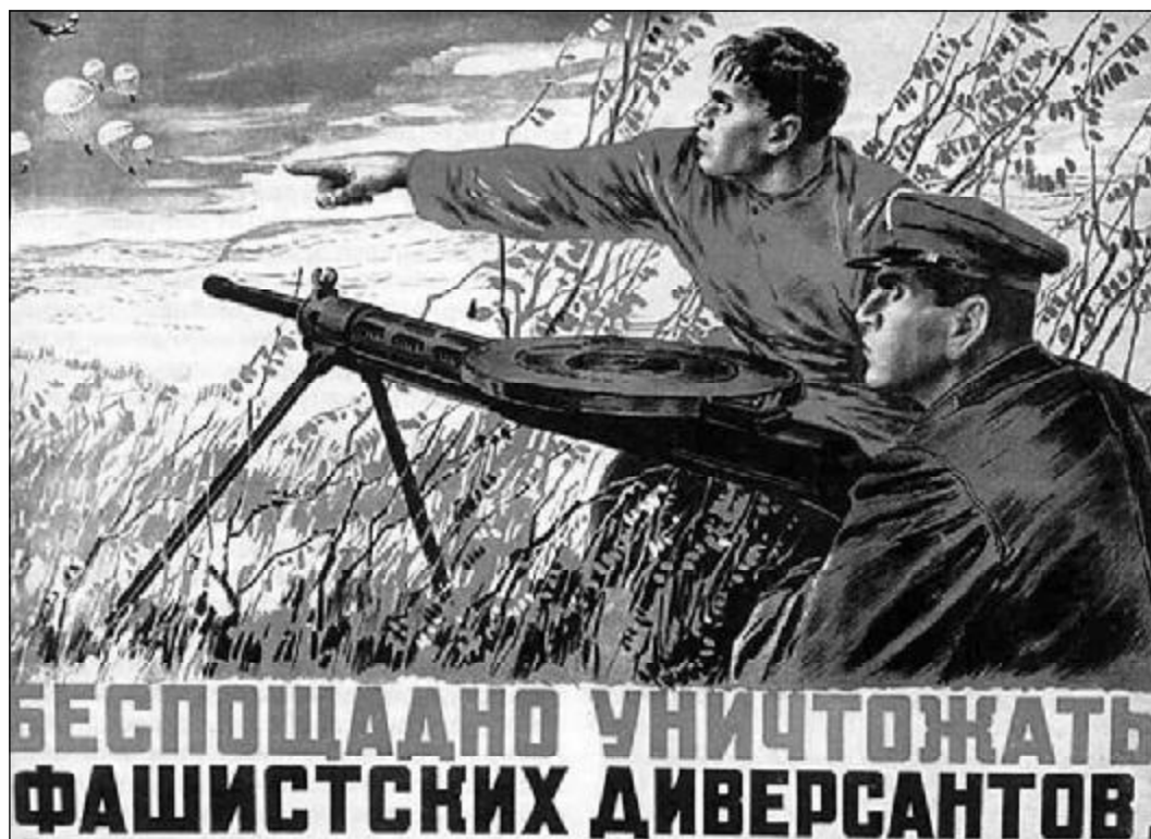
«Беспощадно уничтожать фашистских диверсантов». Плакат 1941 года.