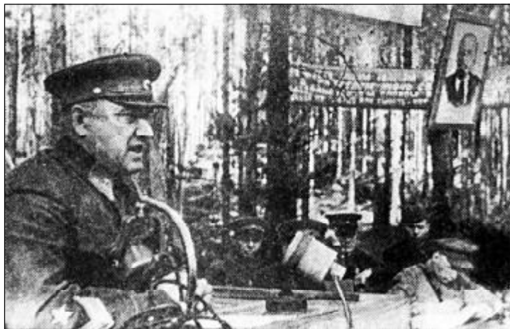
Командующий Северо-Западным фронтом генерал-лейтенант П.А.Курочкин. Сентябрь 1942 г.