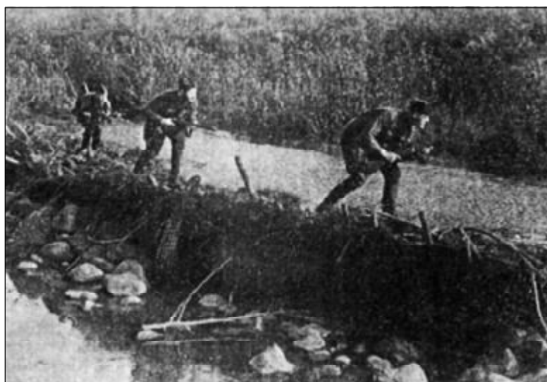
У реки Ловать. 1942 г.