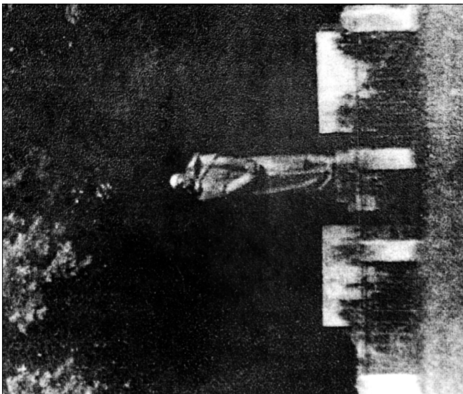
Мемориал на братском кладбище воинов Северо-Западного фронта. 1941-1943 гг. С. Волок на Сереже.