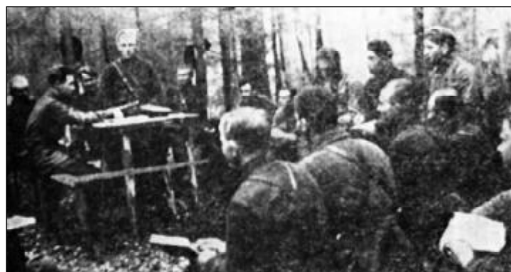
На командном пункте 254-й стрелковой дивизии. Май 1942 г.