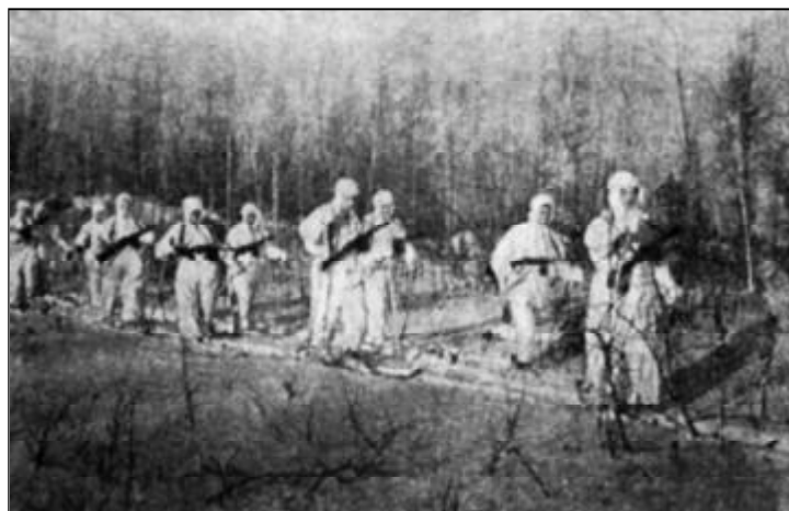
Отряд красноармейцев-лыжников. Северо-Западный фронт, зима 1942 г.