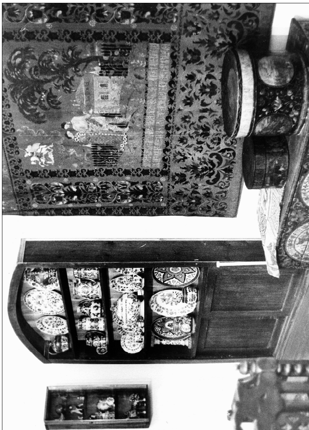
Фрагмент экспозиции Музея-квартиры Ю.П. Слегальского.