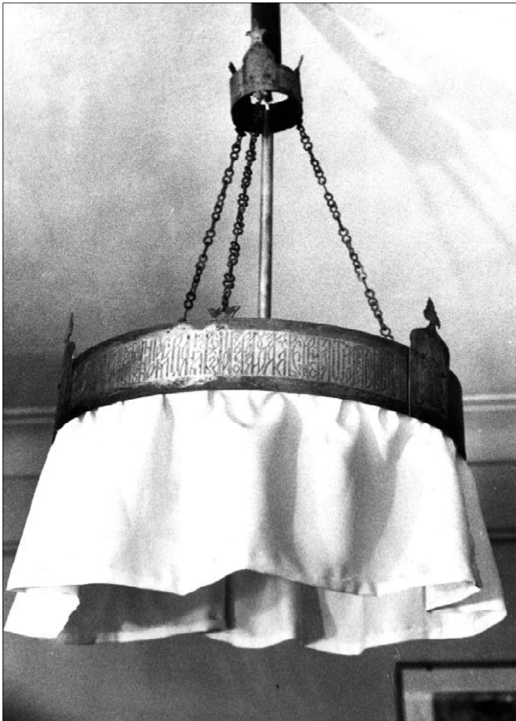
Хорос - металлический подвесной светильник. 1963 г.