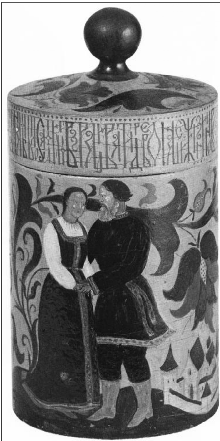
Шкатулка расписная. Последняя работа Ю.П.Спегальского. 1968 г.