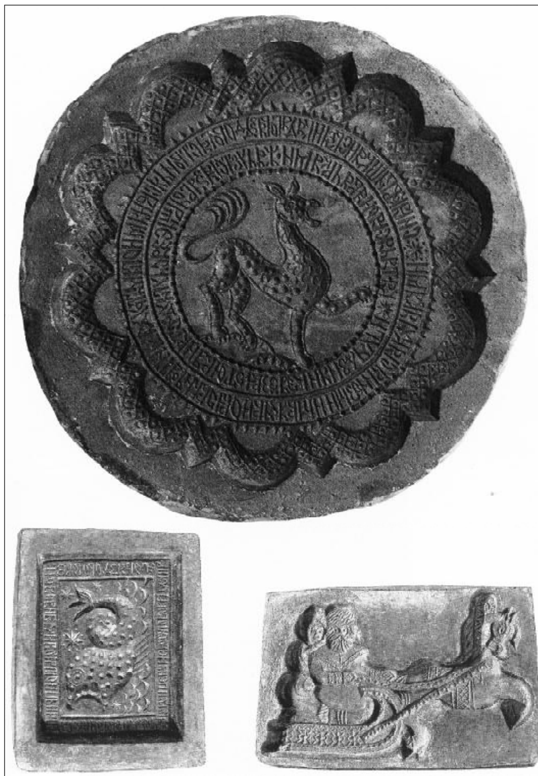
Формы для фигурных пряников: «Самому почётному гостю», «Рыба с моря-океана», «На лошадях по реке Великой».