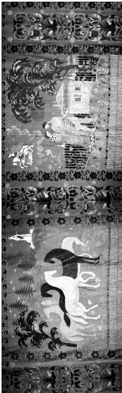
Завеса «опочиваленная». 1958 г.