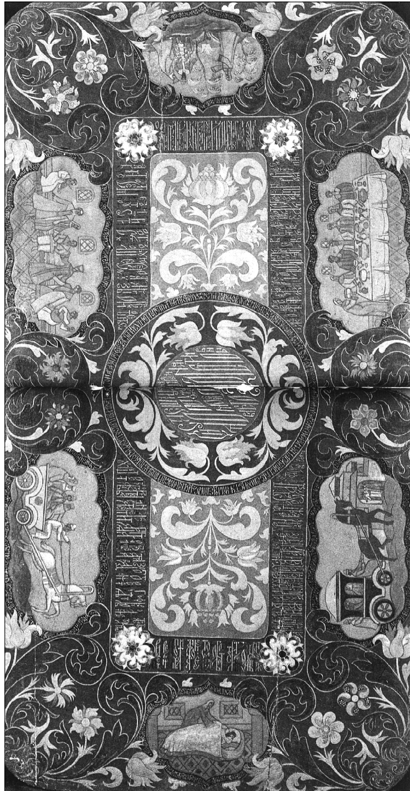
Столешница расписная. 1964 г.