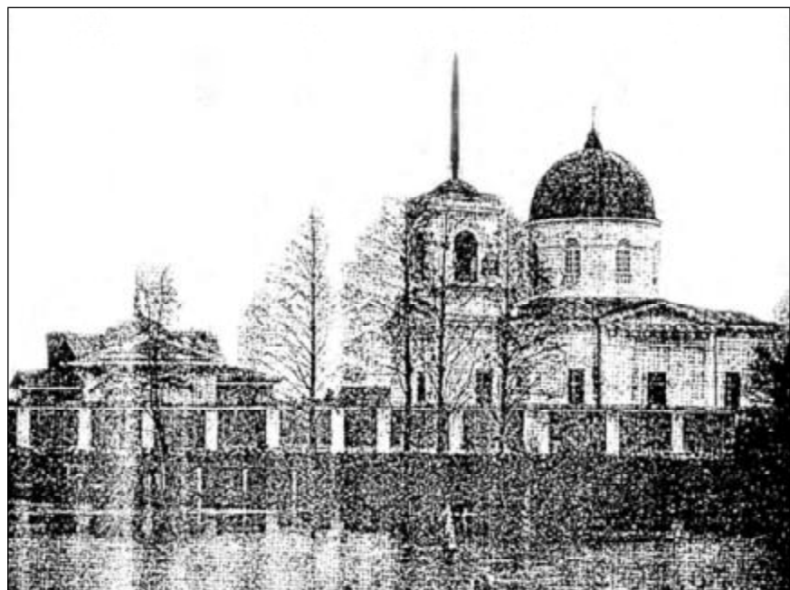
Общий вид Феофиловой пустыни. 1902 г.