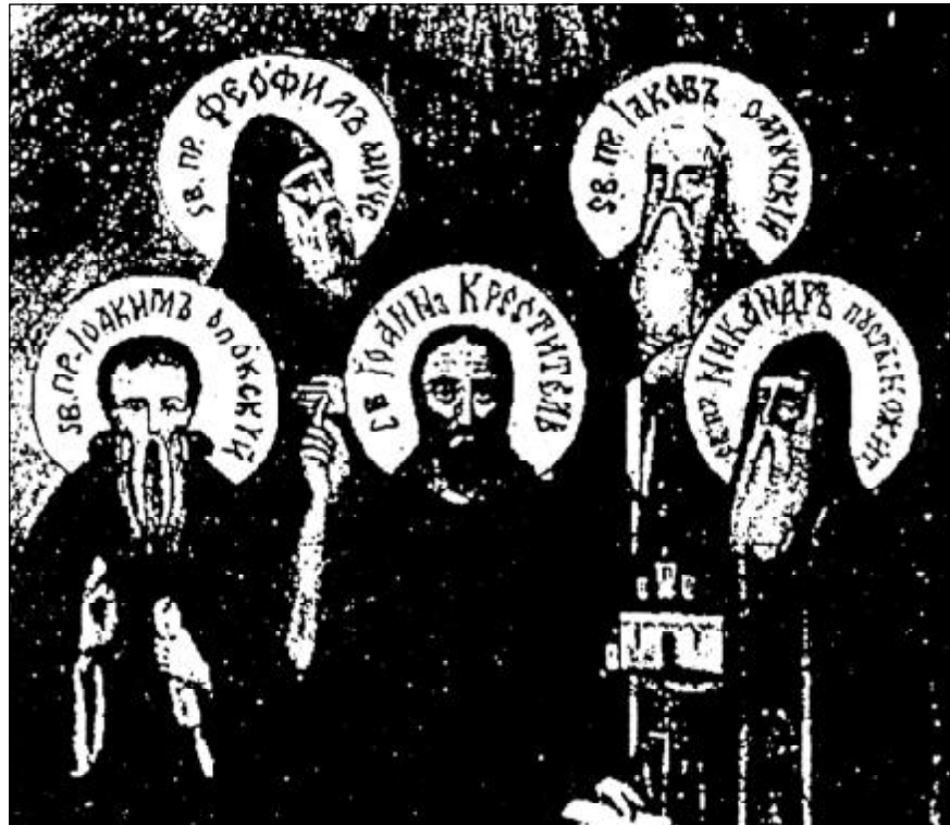
Святой Иоанн креститель, преподобные Феофил Омучский, Никандр Пустынножитель, Иаков Омучский и Иоаким Опокский (псковская икона)