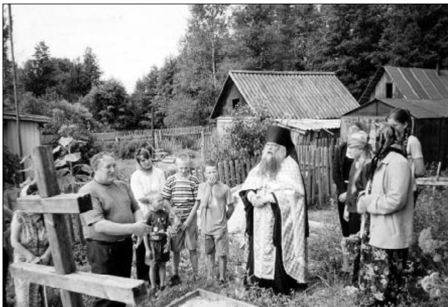
Освящение креста на месте захоронения преподобного Феофила. Лето 2002 г.