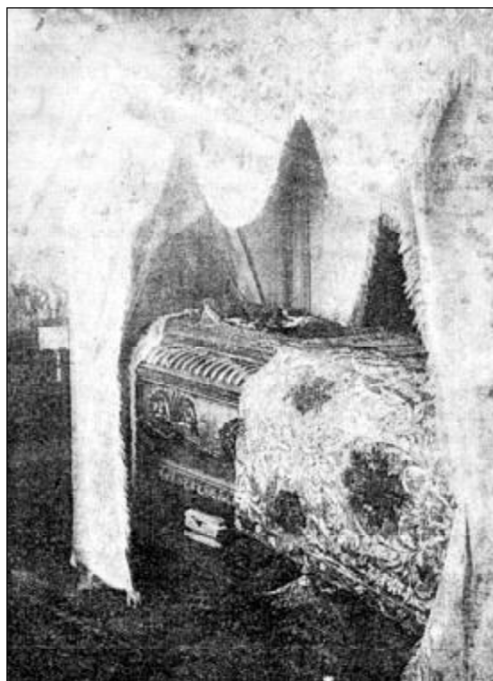
Рака преподобного Феофила Омучского