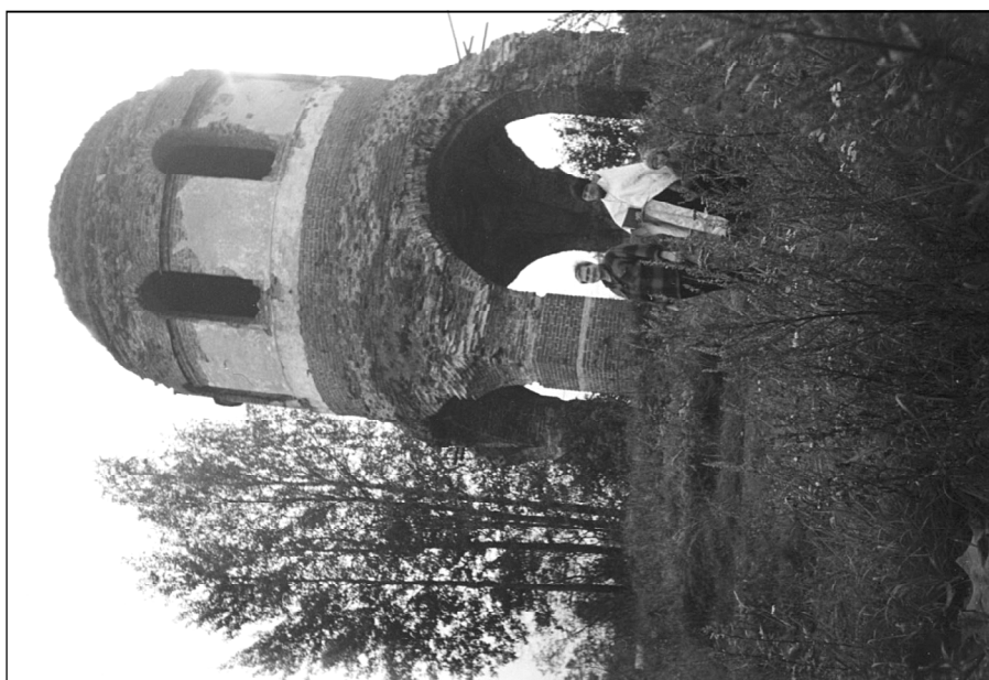
Вид Феофиловой пустыни сегодня