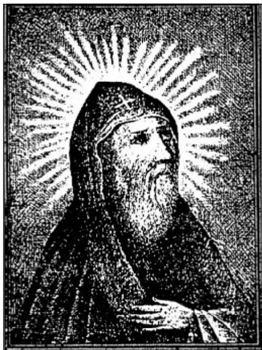
Преподобный Феофил Омучский (с образа XVI века)

В 80 км от Пскова, на территории Хрединской волости Стругокрасненского района, на развилке дорог С.-Петербург – Киев и Великий Новгород проезжающие непременно обращают внимание на остатки некогда красивого храма. Это все, что осталось от существовавшего здесь православного монастыря - Феофиловой пустыни. С этим святым местом связано множество преданий и случаев исцеления, в настоящее же время здесь на огороженной забором территории размещается действующая пилорама. Это кощунство заставляет любого цивилизованного человека задуматься над историей святого места, волей-неволей – над происходящими здесь знаменами. По рассказам местных жителей, за последние десять лет одного из хозяев лесопилки убили, другой разорил-