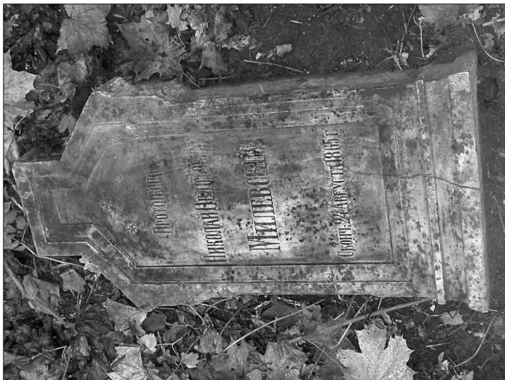
Памятник на могиле Н. Ф. Милевского на Дмитриевском кладбище