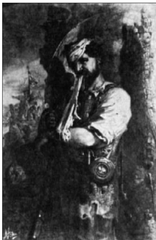
Рерих Н.К. Пскович (1894).