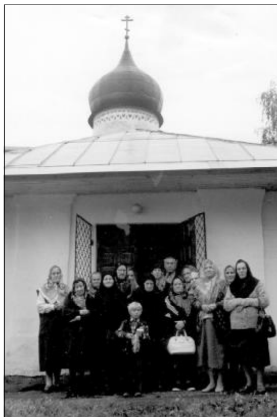
Псковские старообрядцы-поморцы около церкви Святителя Николая Чудотворца от Каменной ограды. Фото 1999 г.