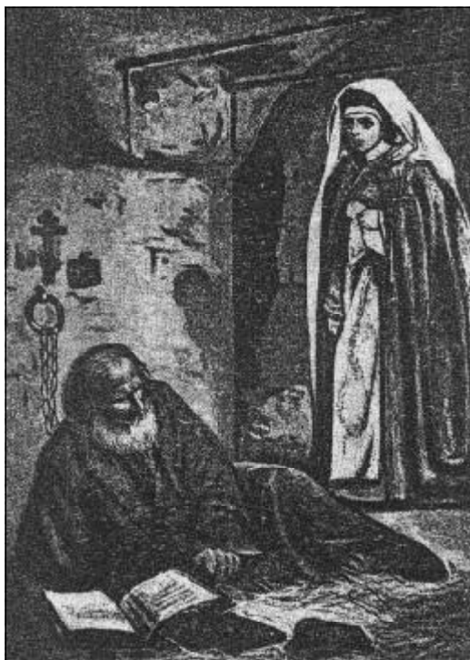
Боярыня Морозова посещает в заключении протопопа Аввакума в подмосковном монастыре Николы на Угреше.