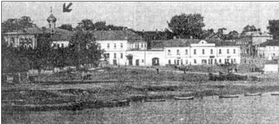
Домовладение П.Д. Батова на Конной улице и поморская моленная при его доме. Фоторепродукция с открытки М.М. Медникова конца 1900-х годов.