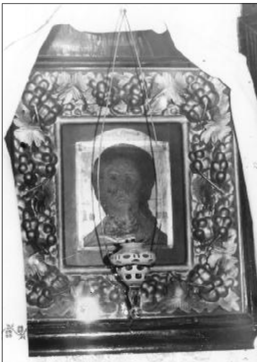
Икона «Господь Вседержатель» древне-русского письма в окладе из божницы старообрядцев Ильиных.