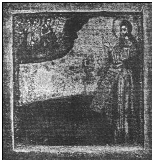
Редкая икона святого мученика протопопа Аввакума, который особо почитается старообрядцами.