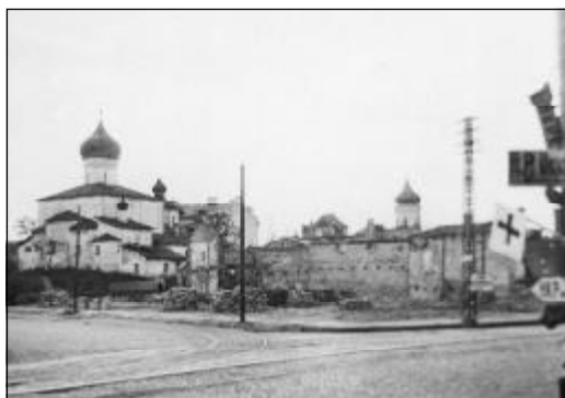
Церковь Василия на Горке, переданная в 1942 г. псковским старообрядцам-поморцам. Фото 1942 г.