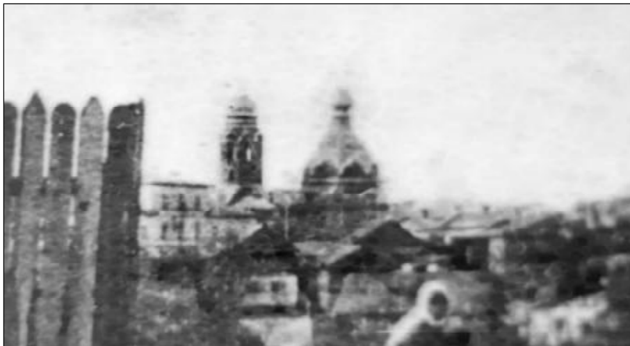
Старообрядческая церковь святых Козмы и Дамиана на Лесной улице. Фото 1918 г.