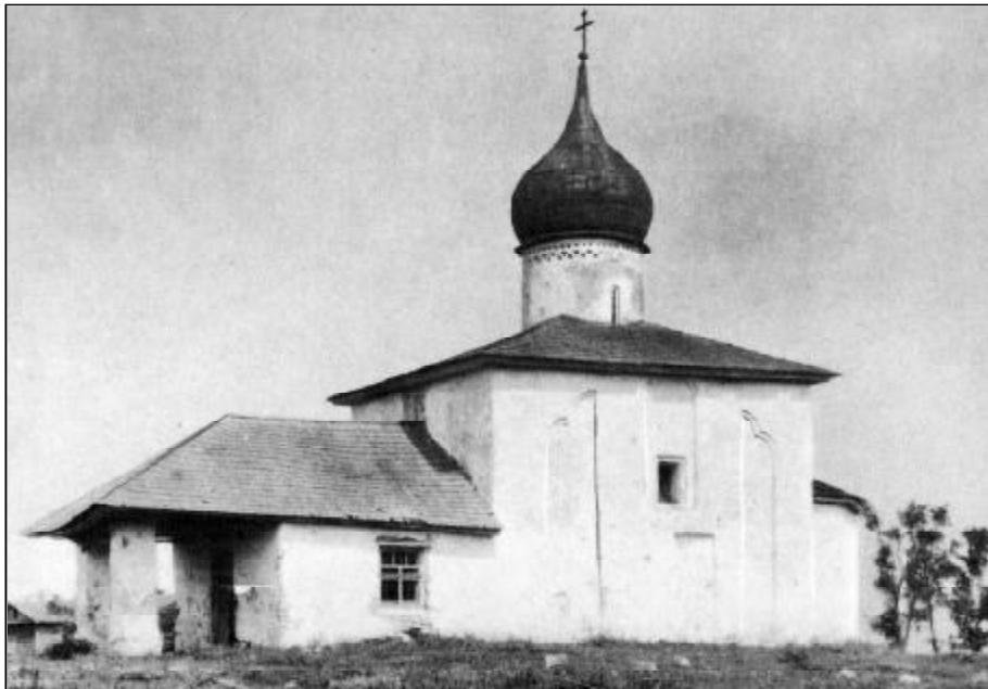
Старообрядческая церковь святителя Николая Каменноградского. Фото 1967 г.