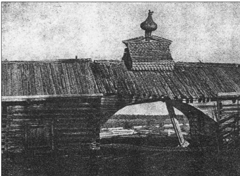
Остатки ограды и ворот Выгорецкого монастыря - духовного центра поморского староверия. Фото 1908 г.