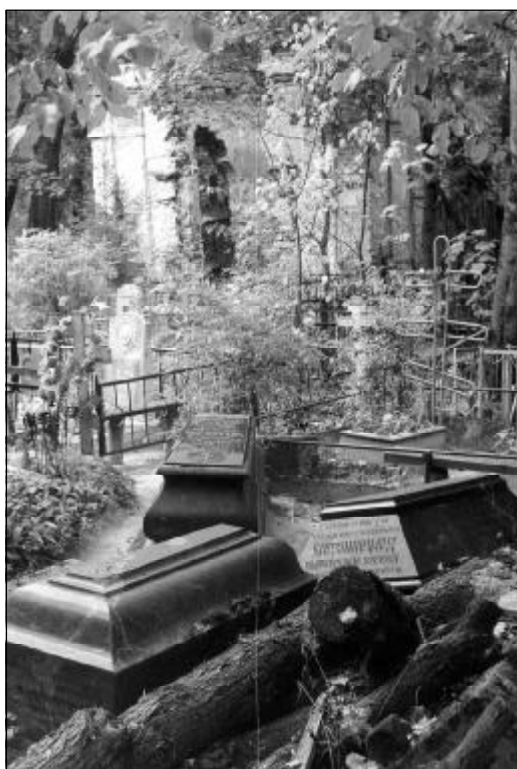
Надгробия на месте разрушенного некрополя Хмелинских на Мироносицком кладбище. Фото 1999 г.