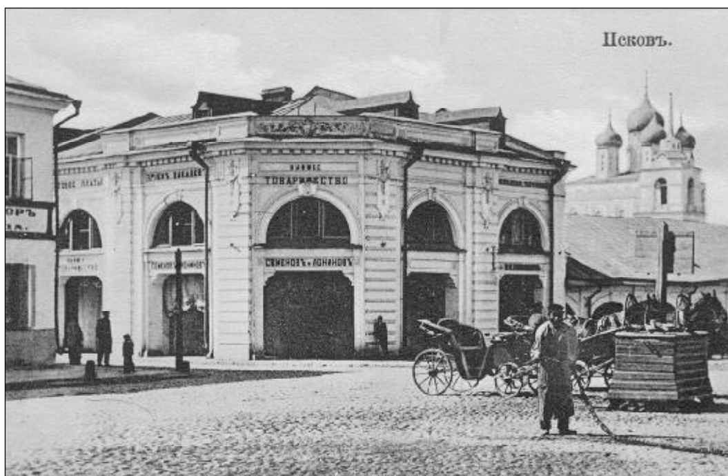
Магазин К.И. Семенова у Гостиного двора