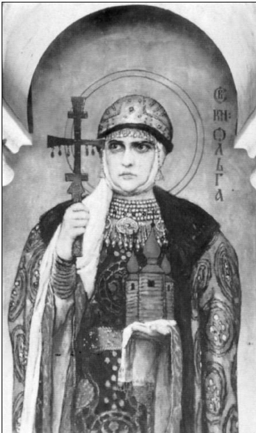
Святая равноапостольная Великая Княгиня Российская Ольга