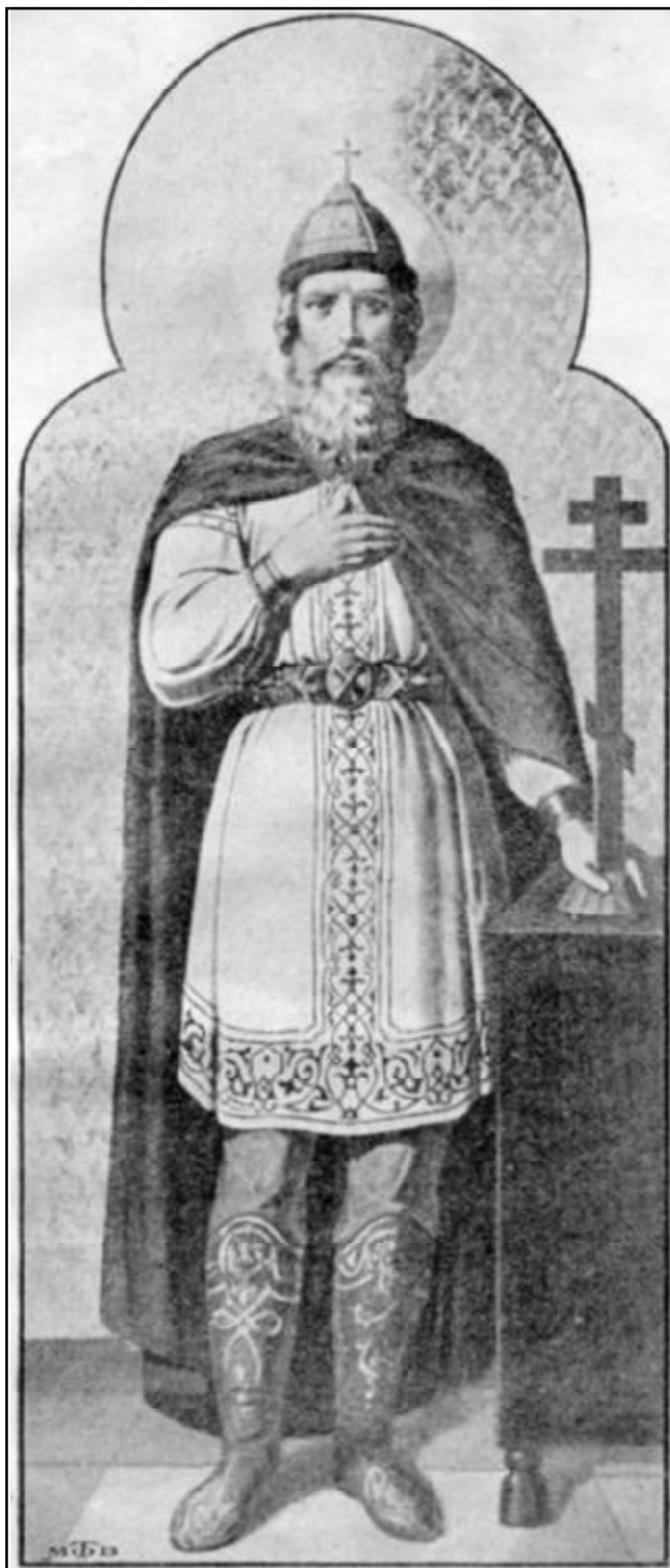
Святой равноапостольный Великий Князь Владимир