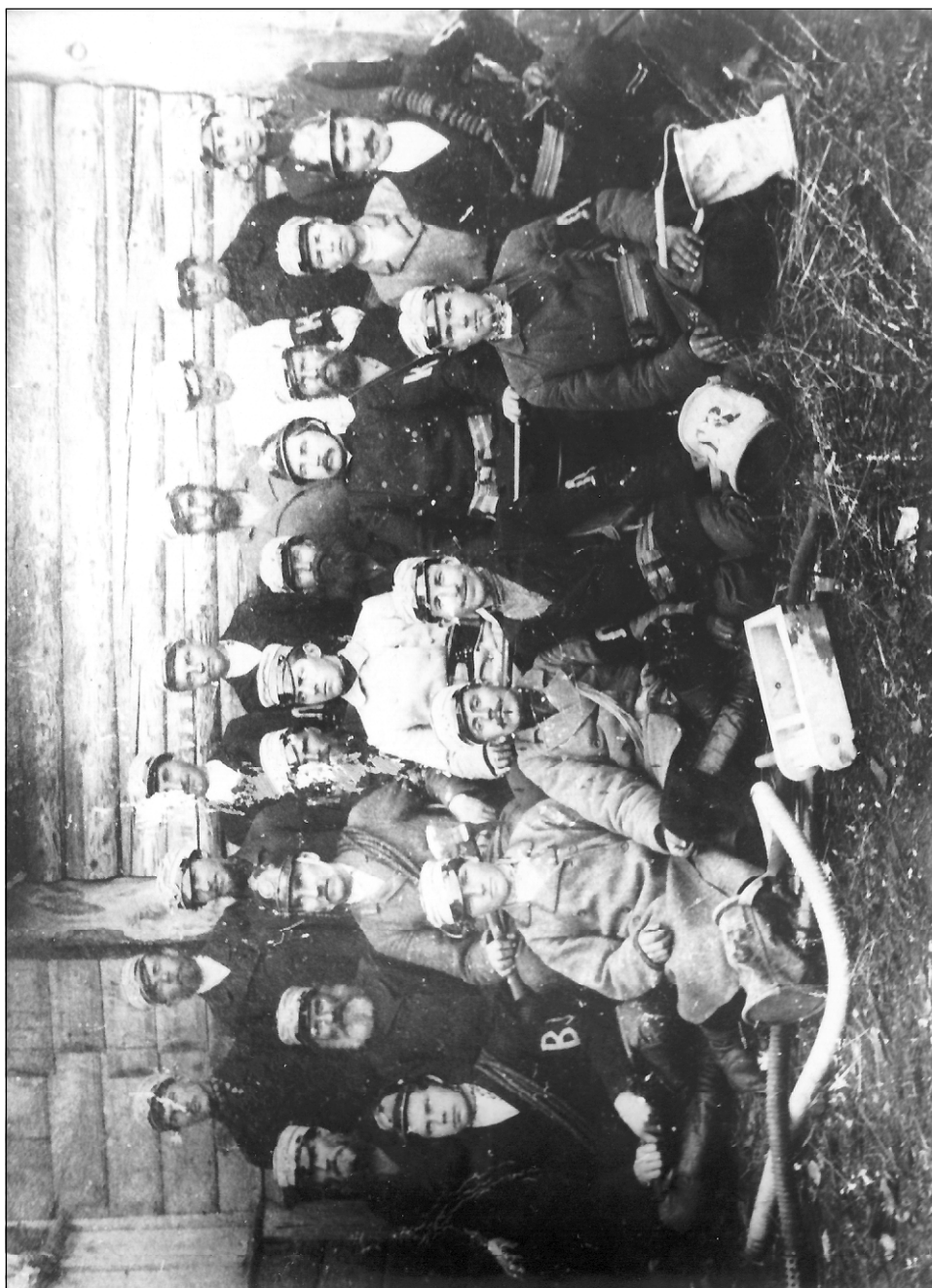
Туровская пожарная команда. 1902 г.