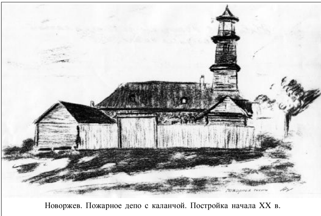
Новоржев. Пожарное депо с каланчой. Постройка начала XX в.

(ГАПО, ф. 20, оп. 1, д. 2327, л. 127; сохраняется правописание источника)