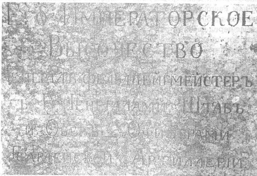
Надпись на памятнике - восточная сторона (снято 2 марта 1998 г.).