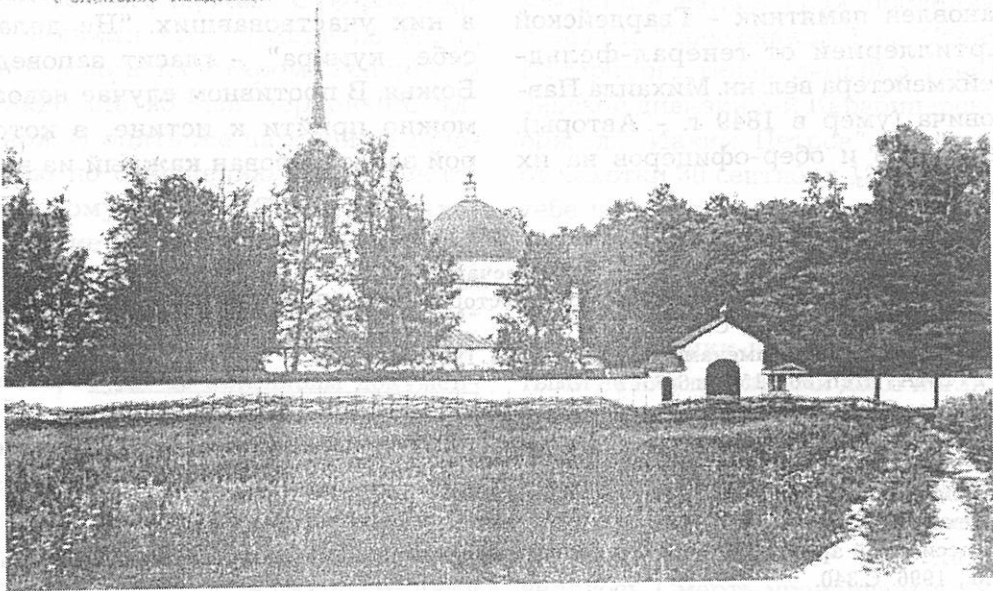
г. Великие Луки. Успенское кладбище.