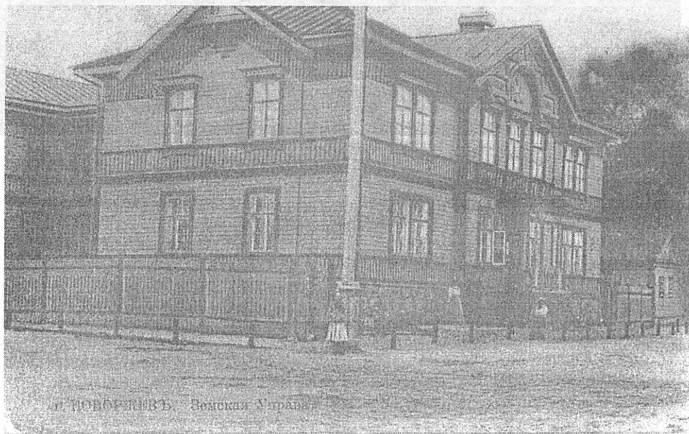
Новоржев. Здание земской управы. Разрушено в годы Великой Отечественной войны.