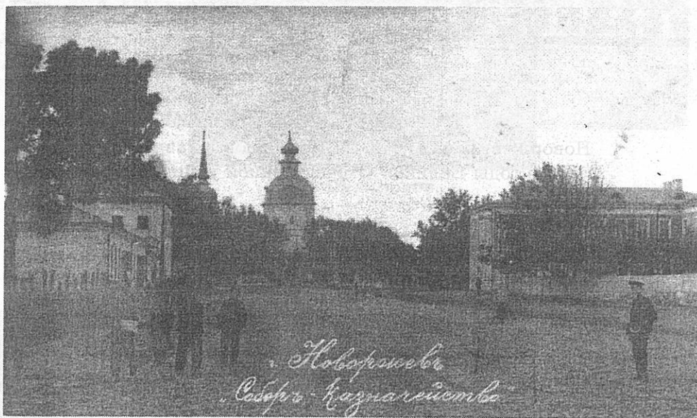
г. Новоржев. Собор-казначейство