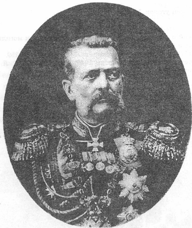
Великий князь Владимир Александрович.