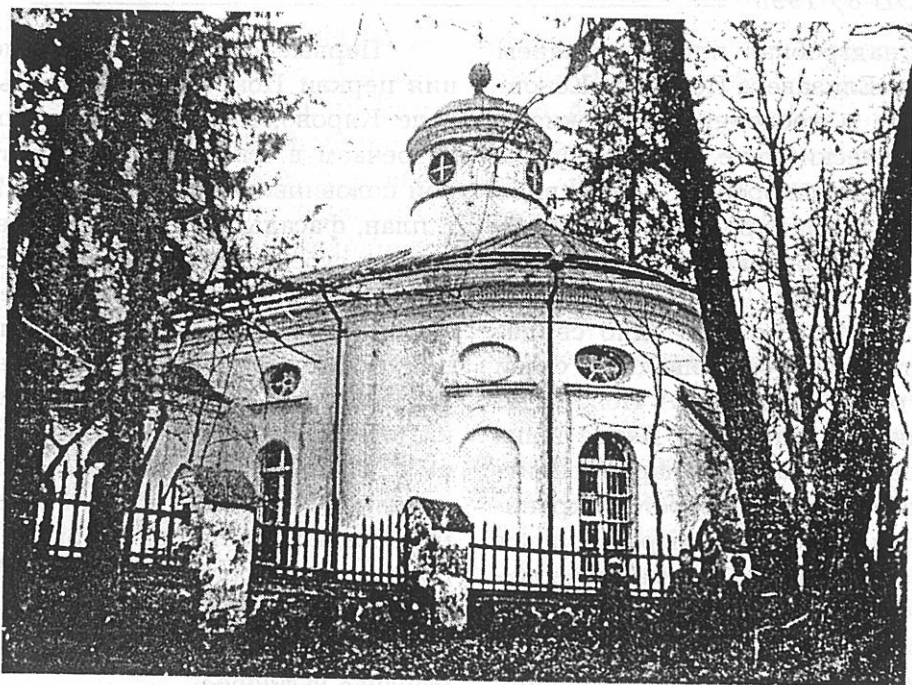
С. Кярово. Гдовский у. Церковь.