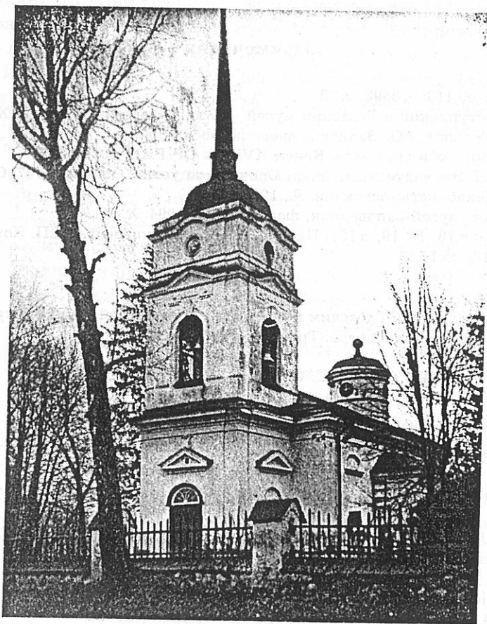
С. Кярово Гдовский у. Церковь.