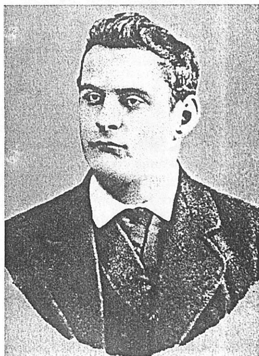
Эндрью (Андрей Антонович) Фишер. Нач. 80-х гг. XIX в.