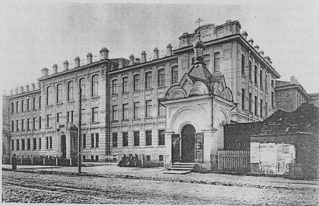
Сергеевское реальное училище. (Арх. Л.М.Харламов, 1908 г.)

Женское епархиальное училище по ул. Спасской. (1900 г. арх. Ф.П.Нестурх.)