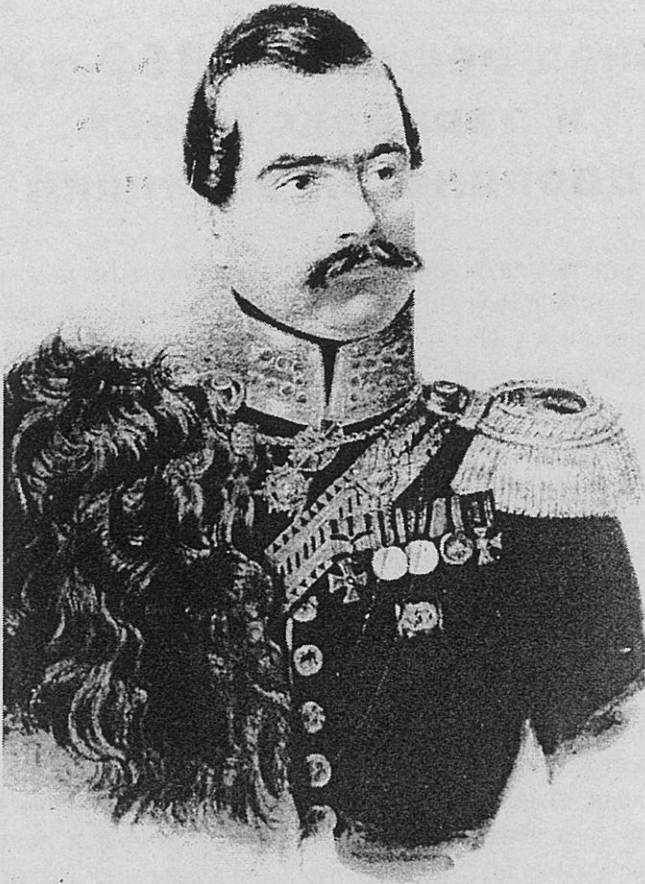
А.Клондер. Портрет полковника лейб-гвардии Гусарского полка Н.И.Бухарова, 1838 г.