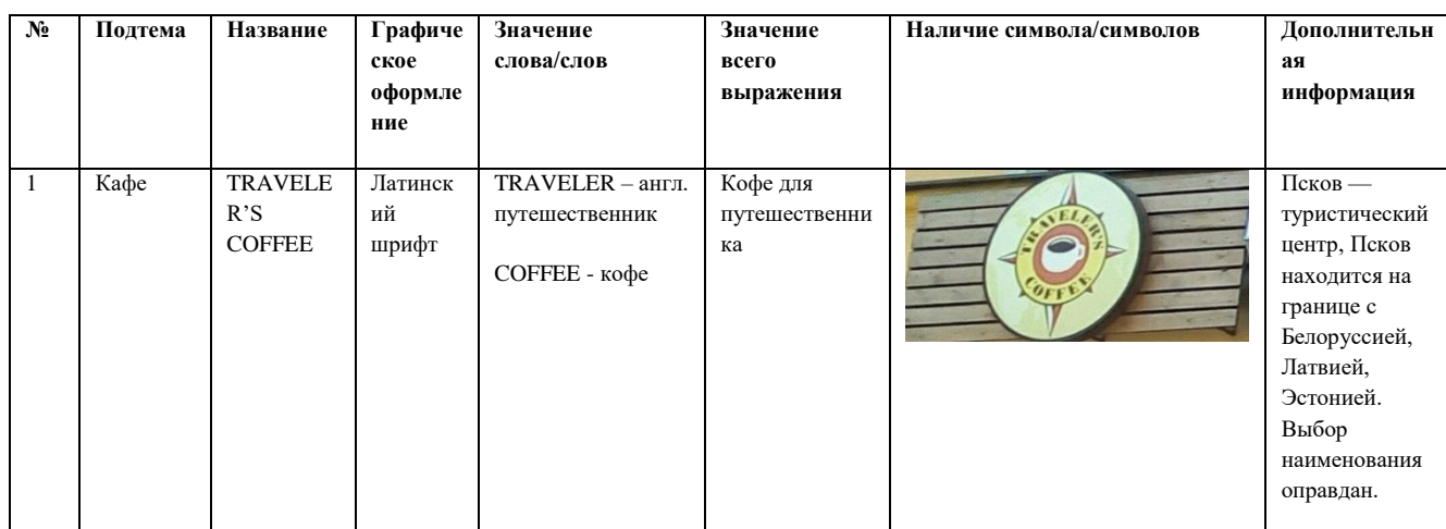
ТАБЛИЦА НАЗВАНИЙ С ОСНОВАМИ АНАЛИЗА