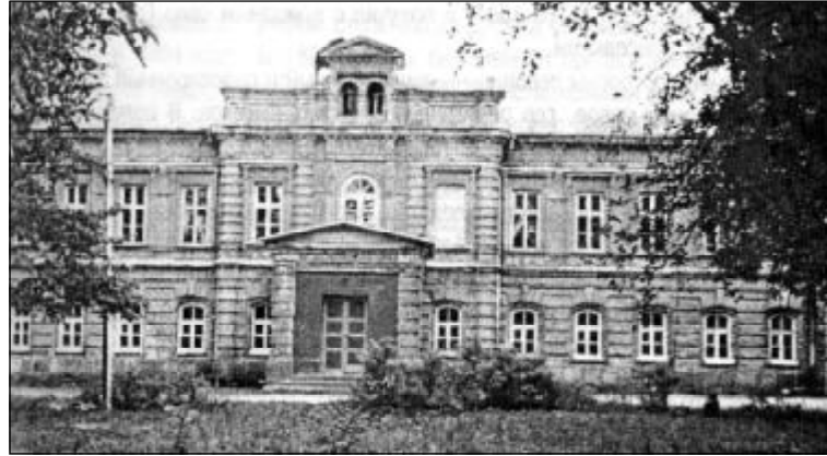
Усадебный дворец Львовых в имени Гора.