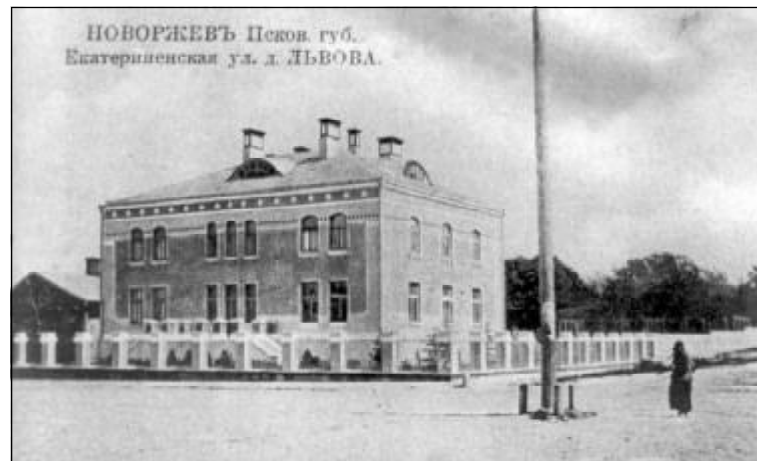
Дом Львовых в Новоржеве.